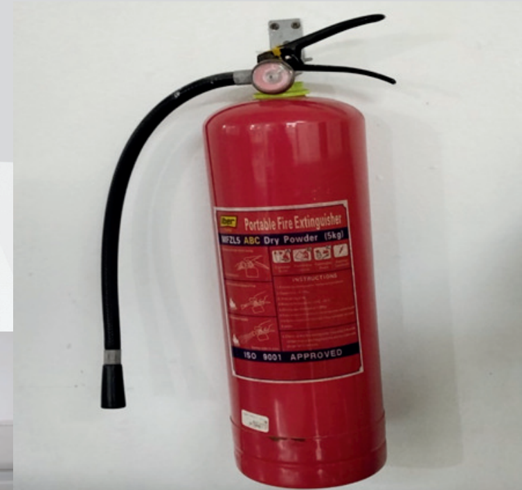
EXTINTOR ACTUALMENTE EN COTIZACION PARA RELLENADO Y NUEVA FECHA