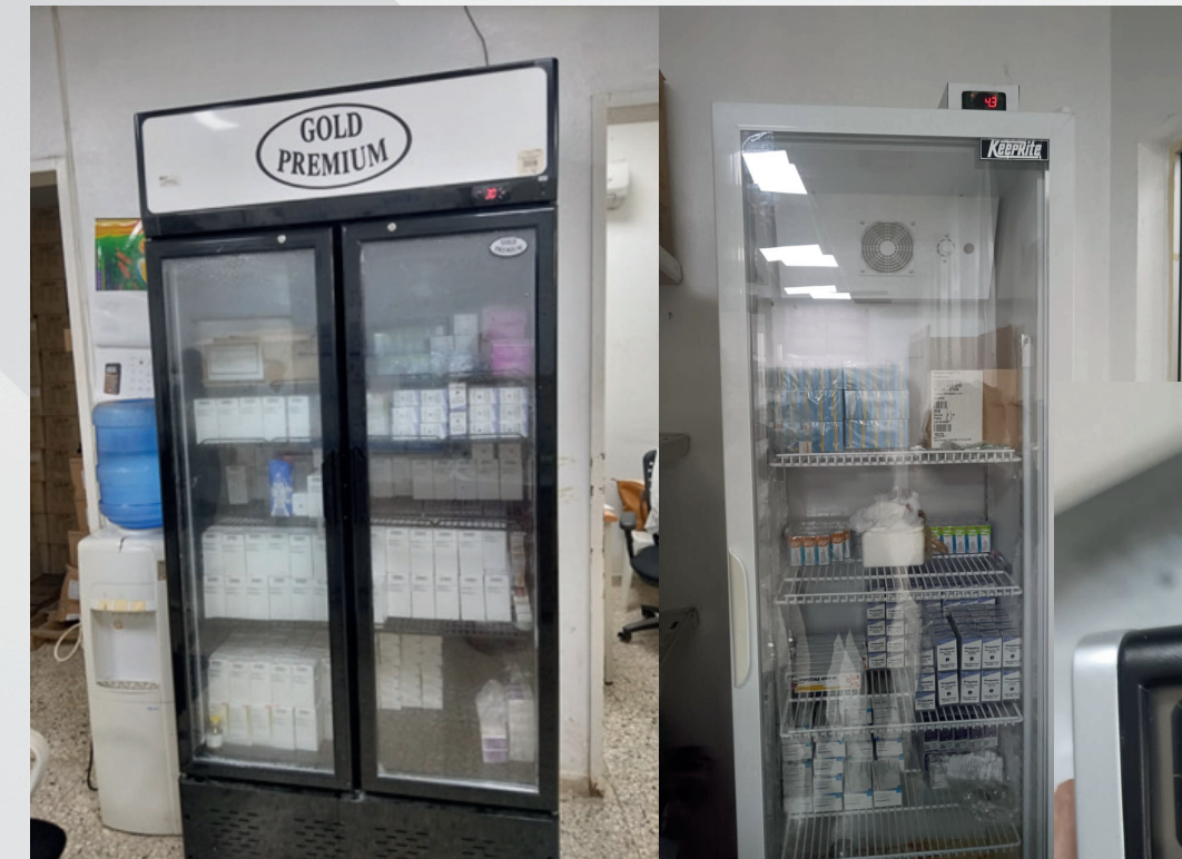
MEDIDOR DE TEMPERATURA Y HUMEDAD