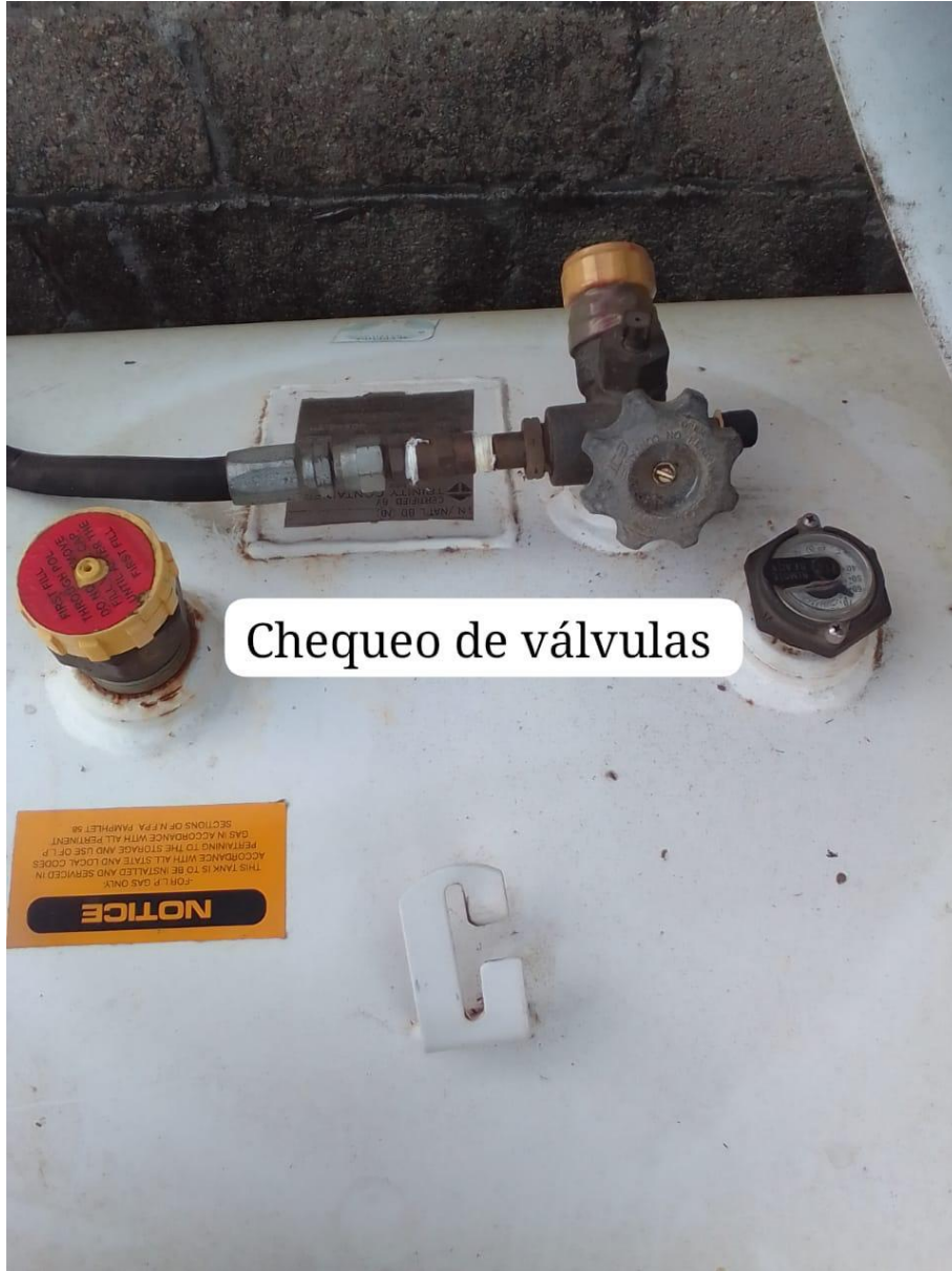
Chequeo de válvulas