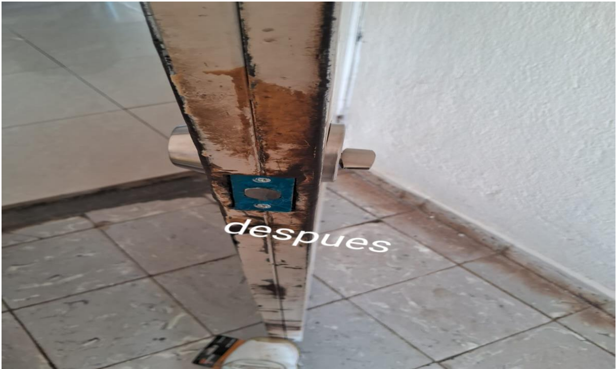
Cambio de cerradura