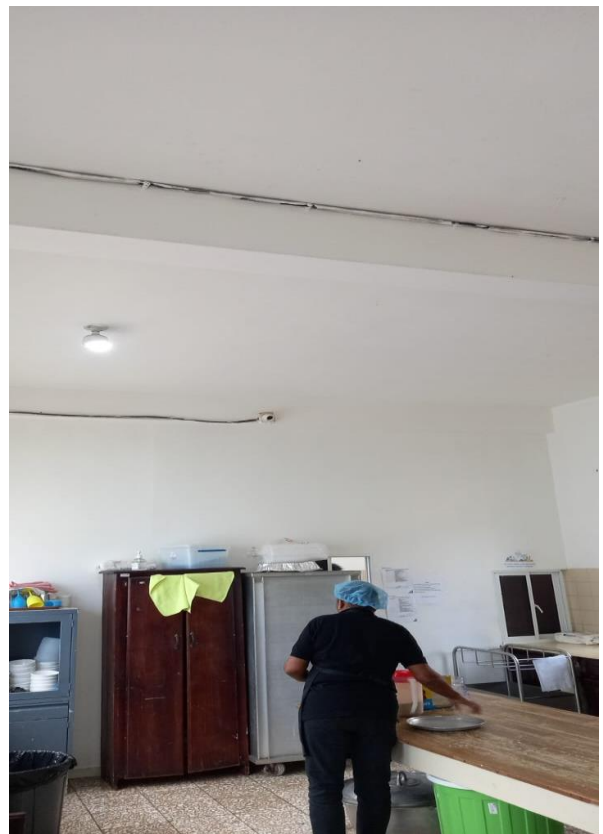
Pintado pared interior de la cocina Fecha 26/02/2024.