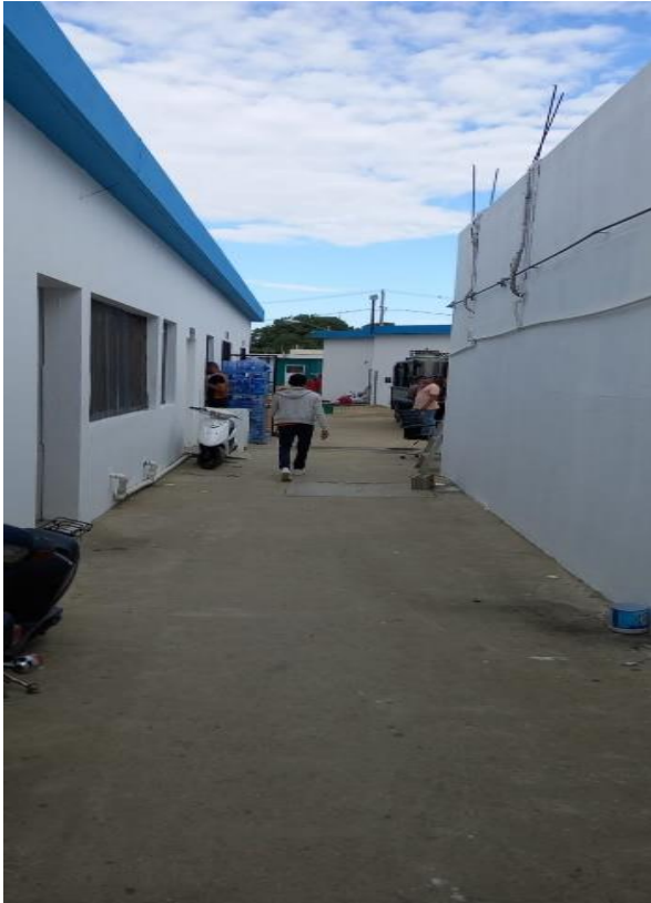
Pintado pared de edificio parte trasera, en fecha 26/02/2024.