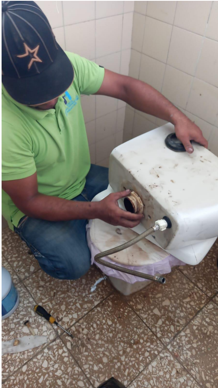
Instalación de inodoro en el departamento del SAI, fecha 16/04/2024.