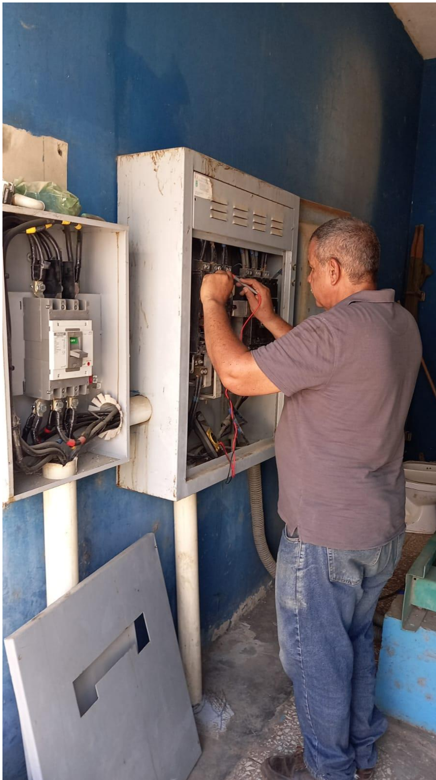
Reparación y cheque sistema eléctrica de la planta física y planta eléctrica de la Maternidad, en fecha 17/04/2024.