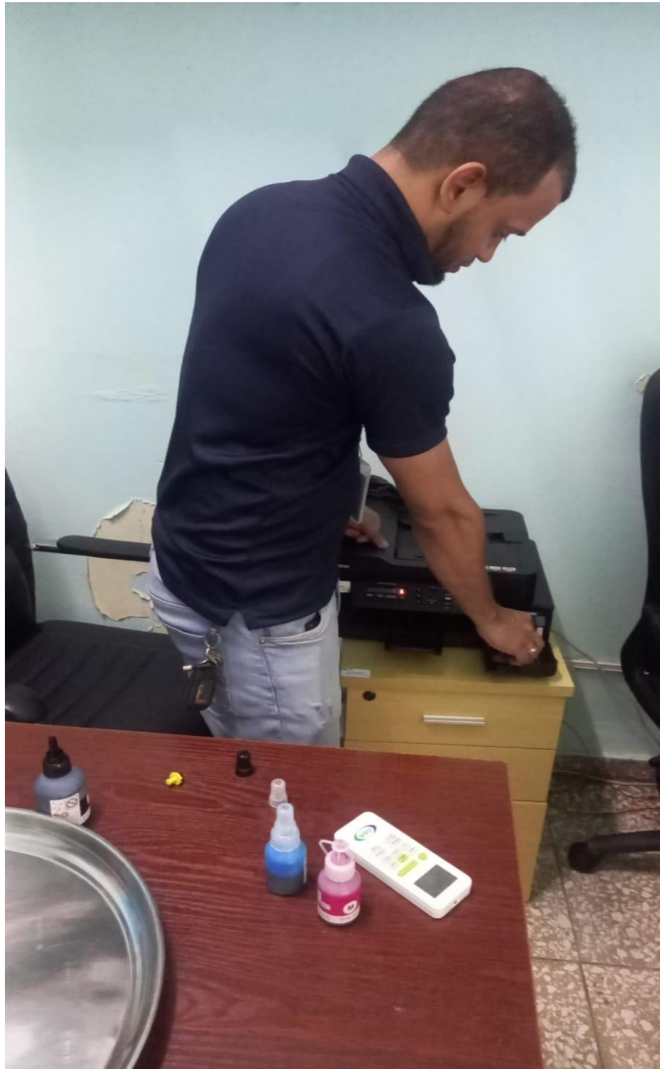
Llenado de cartuchos a impresoras de la maternidad, en 16/04/2024.