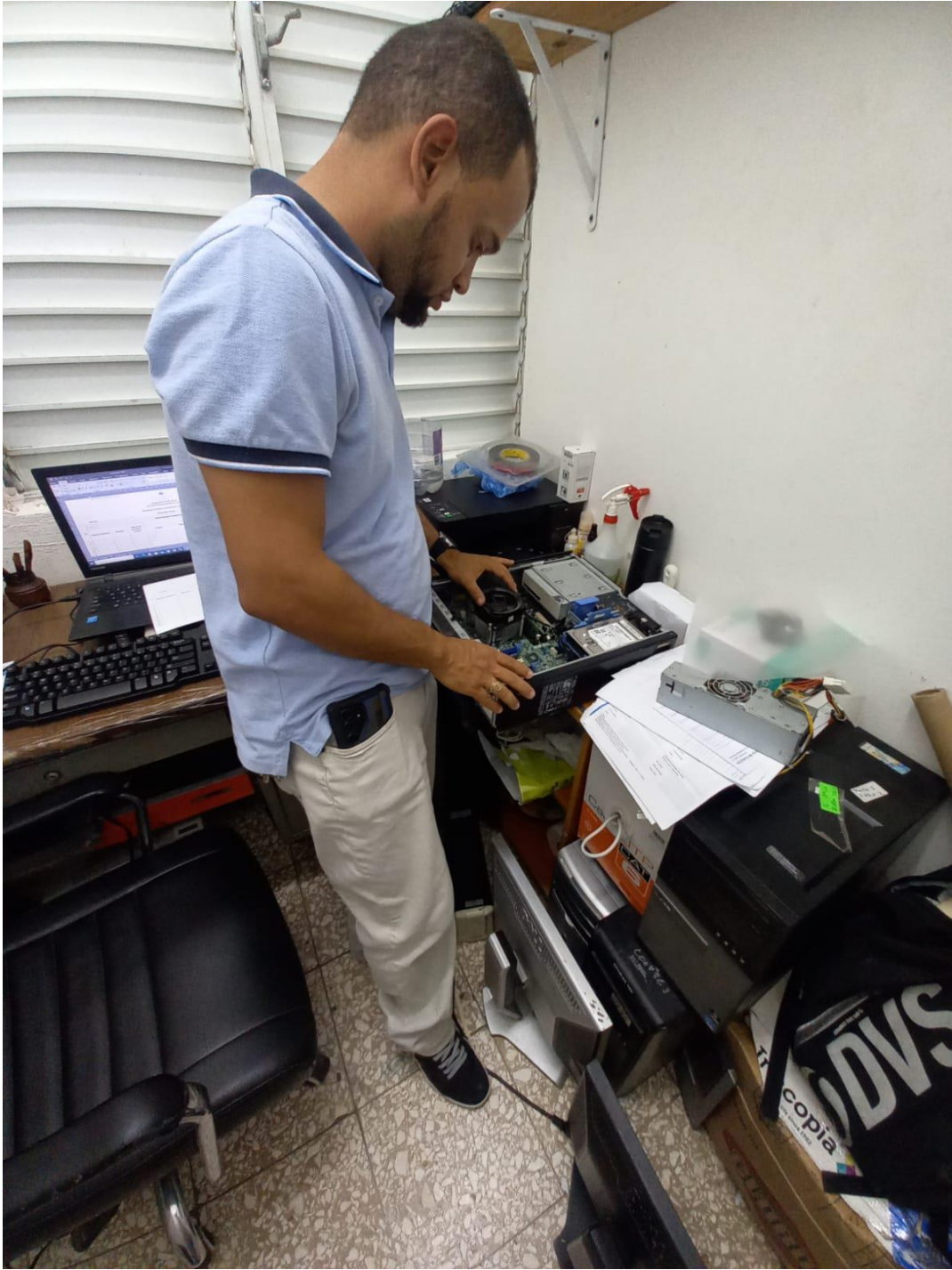
Mantenimiento a equipos cómputos área de Rx en fecha 30/07/2024.