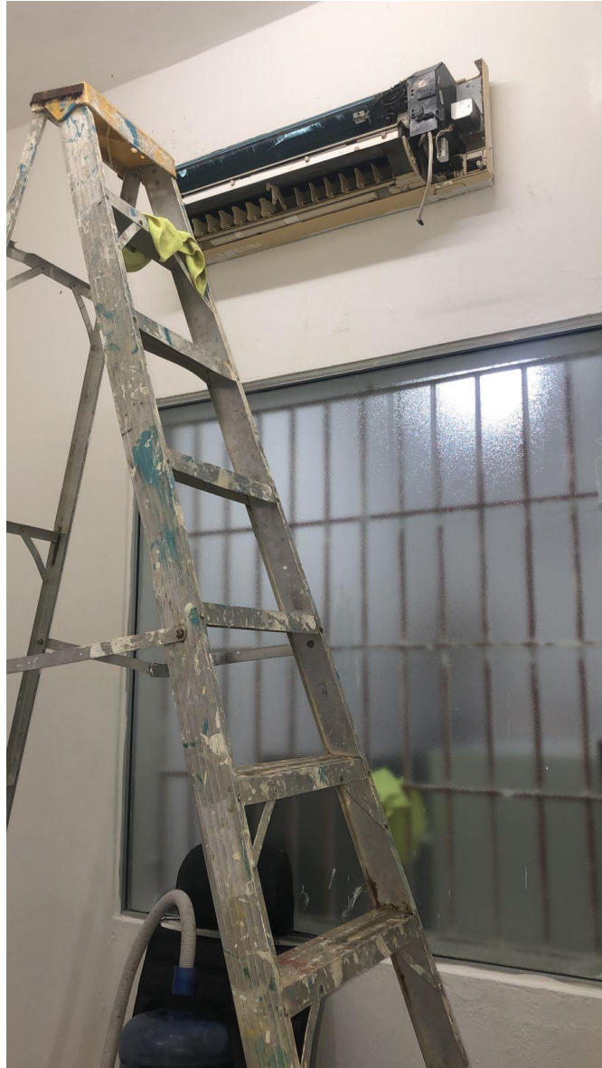
Mantenimiento aire acondicionado en Mama Canguro en fecha 24/07/2024