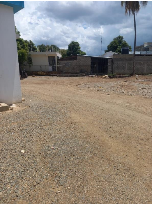
Mantenimiento área de patio parte frontal y trasera de la Maternidad, en fecha 24/07/2024.