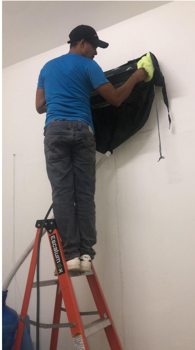
Mantenimiento aire de Colposcopia en fecha 29/07/2024