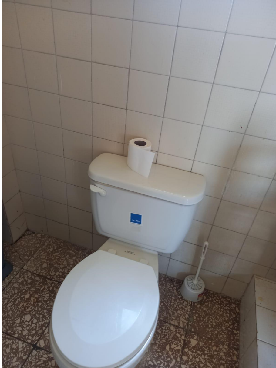
Instalación palanca de inodoro baño área de Limpieza en fecha 31/07/2024