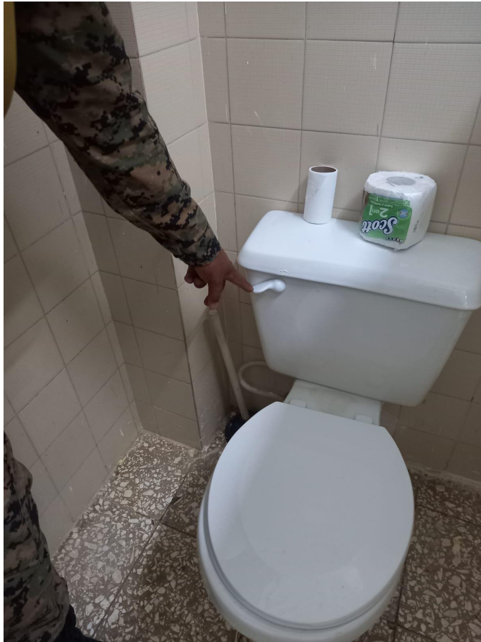
Instalación palanca de inodoro baño cuarto de dormitorio de enfermería en fecha 31/07/2024.