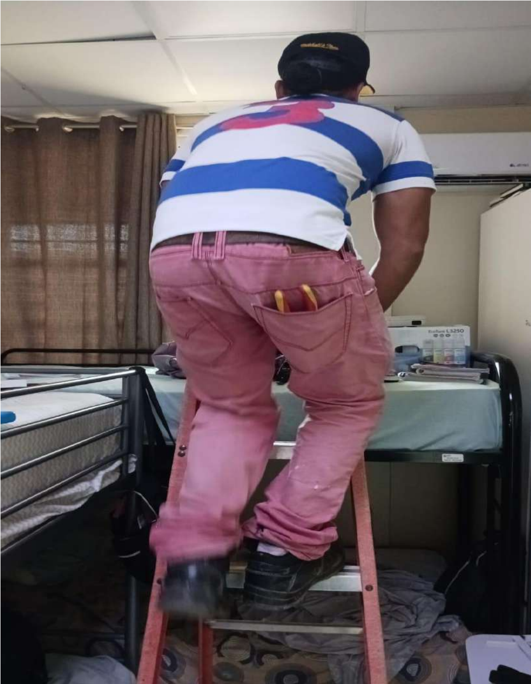
13. Cambio de lámpara en Almacén