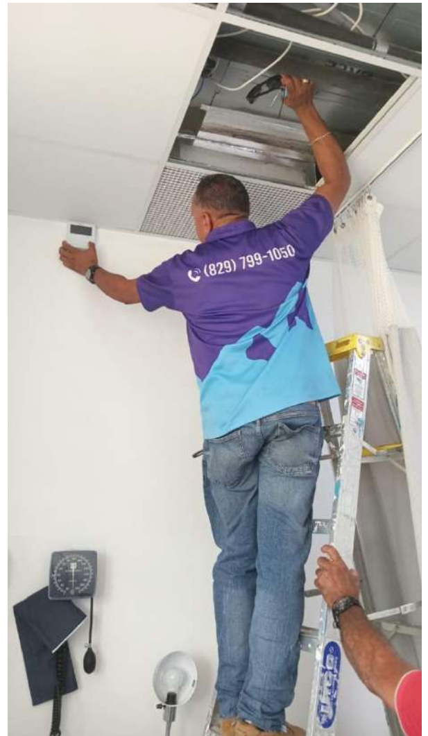
Mantenimiento Correctivo de Aire Consultorio no.02