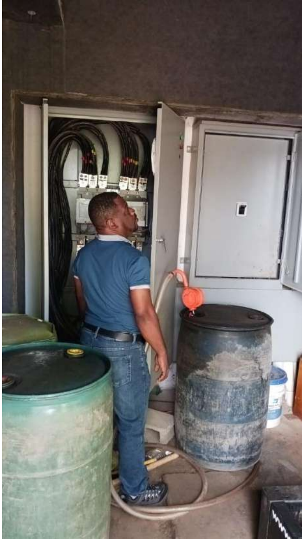
Mantenimiento Preventivo a Cuartos de Basura