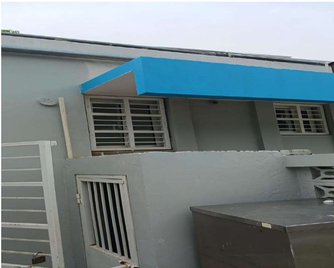
Chequeo de Sonido a Aire de Emergencia