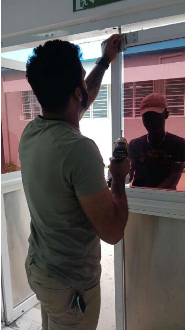
Mantenimiento Preventivo de Limpieza Frente a Lavandería