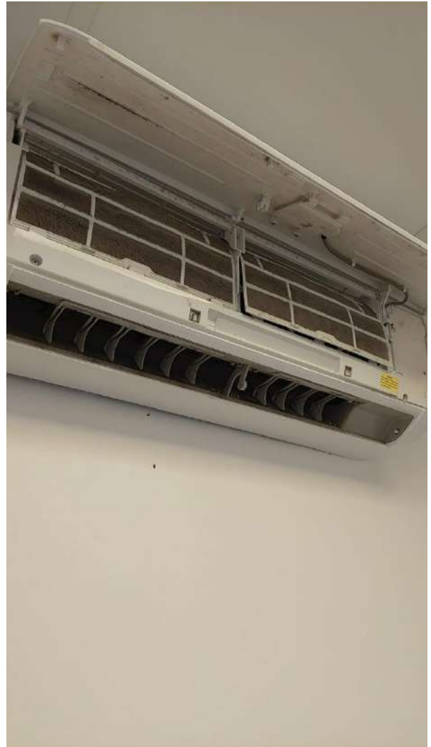
Mantenimiento Correctivo de Aire Consultorio no.03