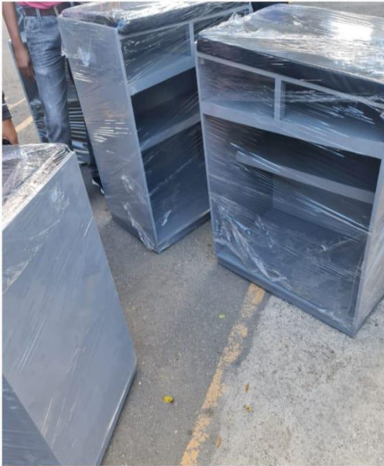
Adquisición de mobiliarios para uso en el área de Mamá Canguro