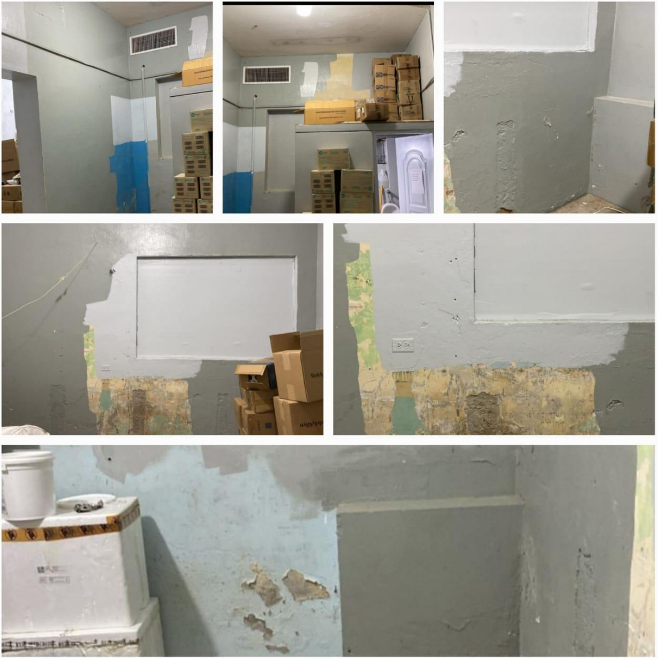
Pintura del Almacén de Farmacia (Antes)