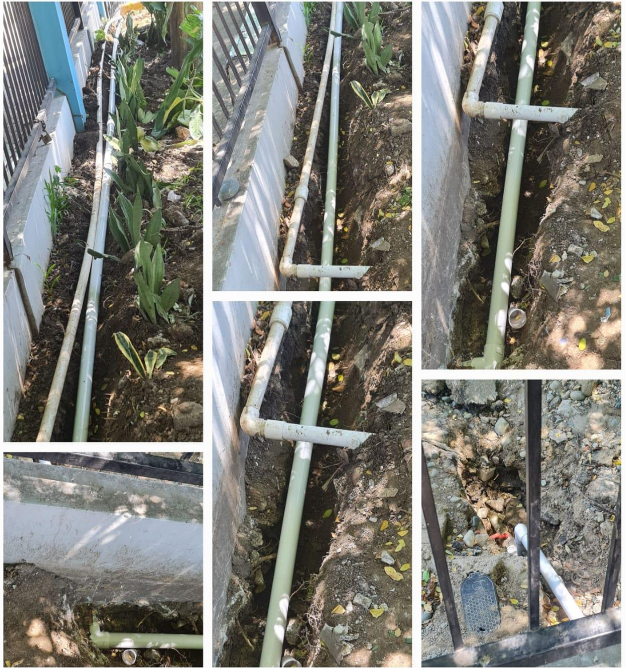
Trabajos de Plomería en diferentes áreas