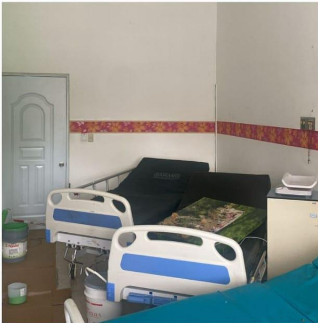
Pintura del Área de Canguro Intrahospitalario (Antes)