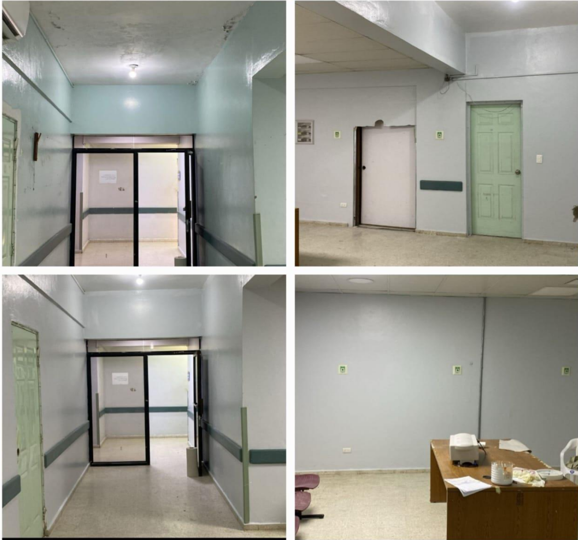
Pintura Área de Esterilización de Neonatología (Ahora)