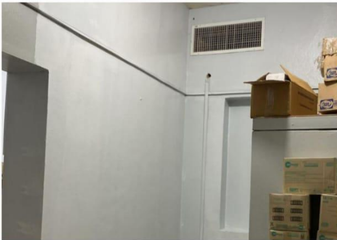
Pintura del Almacén de Farmacia (Ahora)