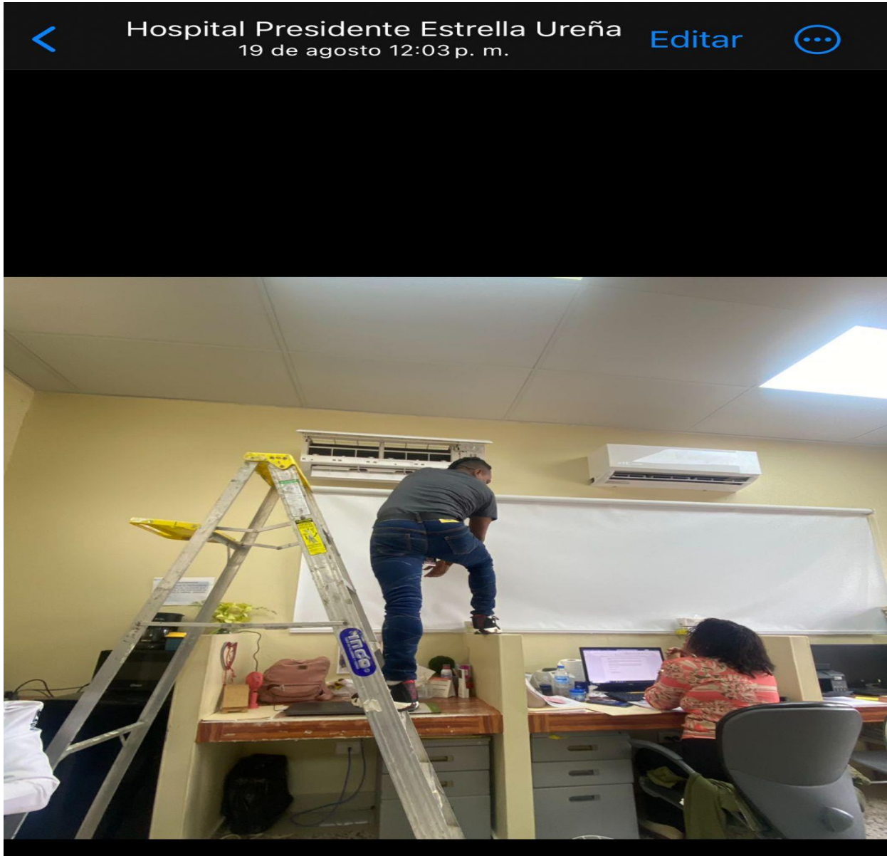
Mantenimiento Aires Acondicionados