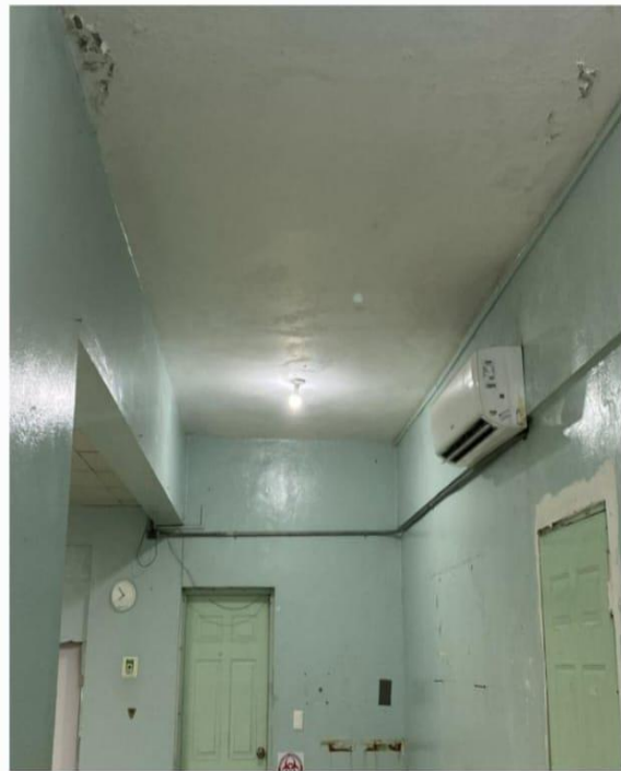
Pintura área de esterilización de Neonatología (Antes)