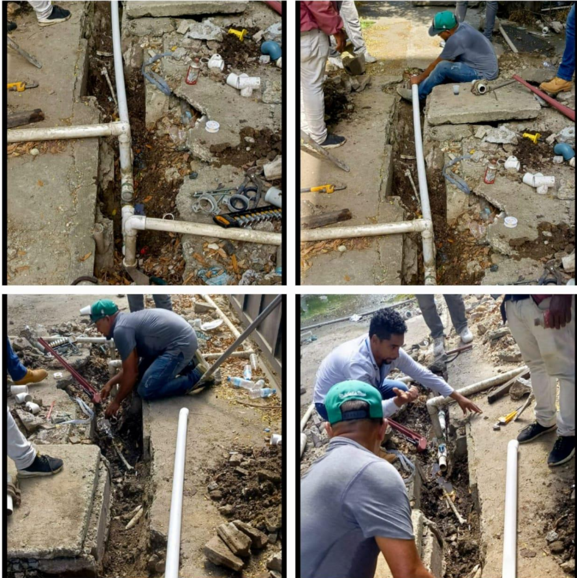
Trabajos de Plomería en diferentes áreas