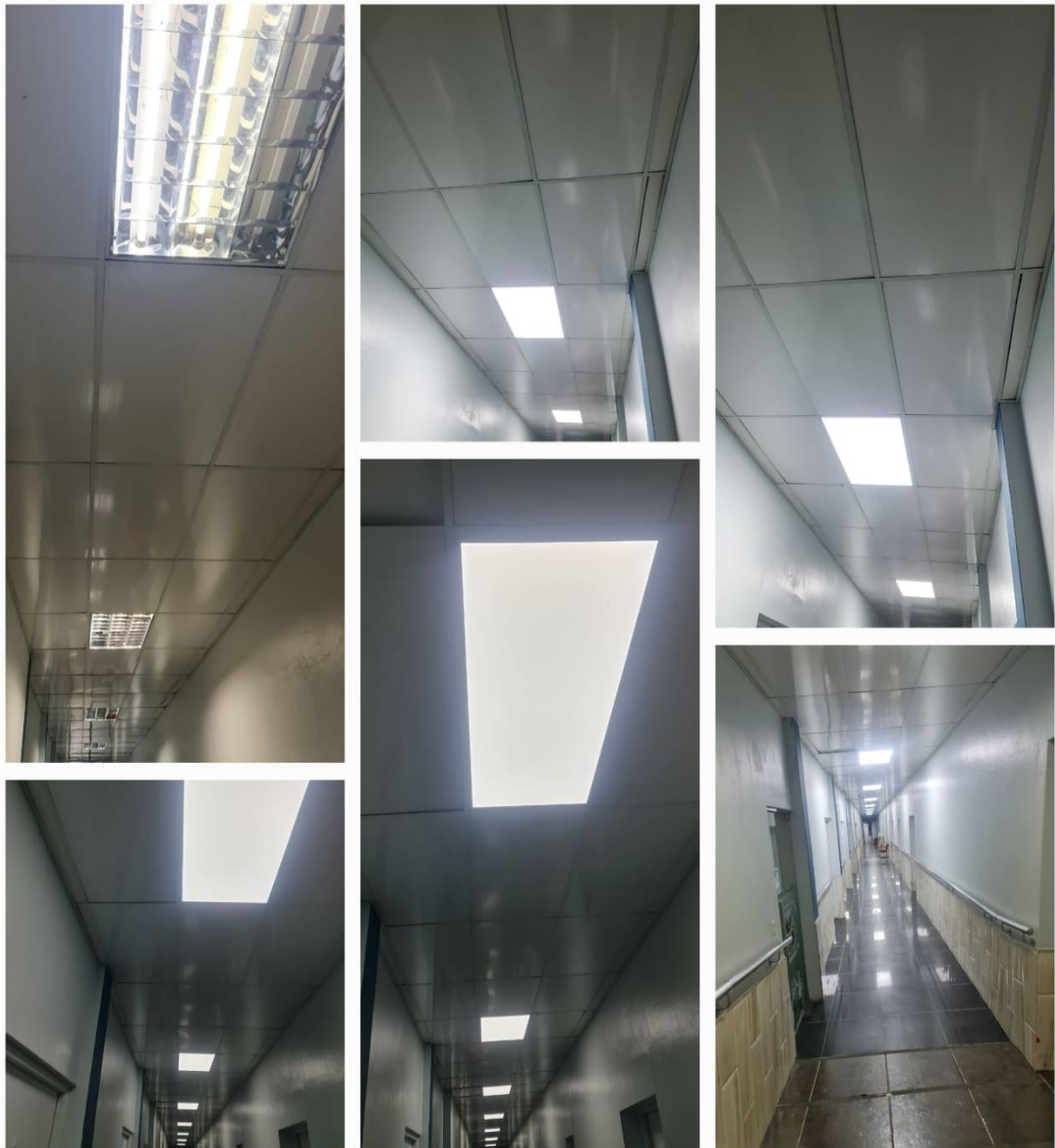
Mejoras de la Iluminación de diferentes Áreas: Pasillo Áreas Administrativa y Dirección General (Antes/Ahora)