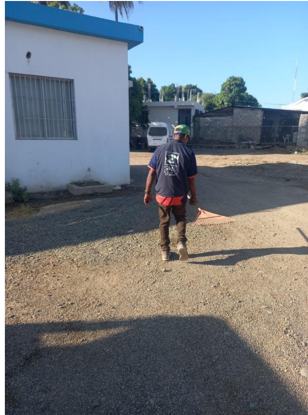
Mantenimiento y limpieza de patio en fecha 29/08/2024.