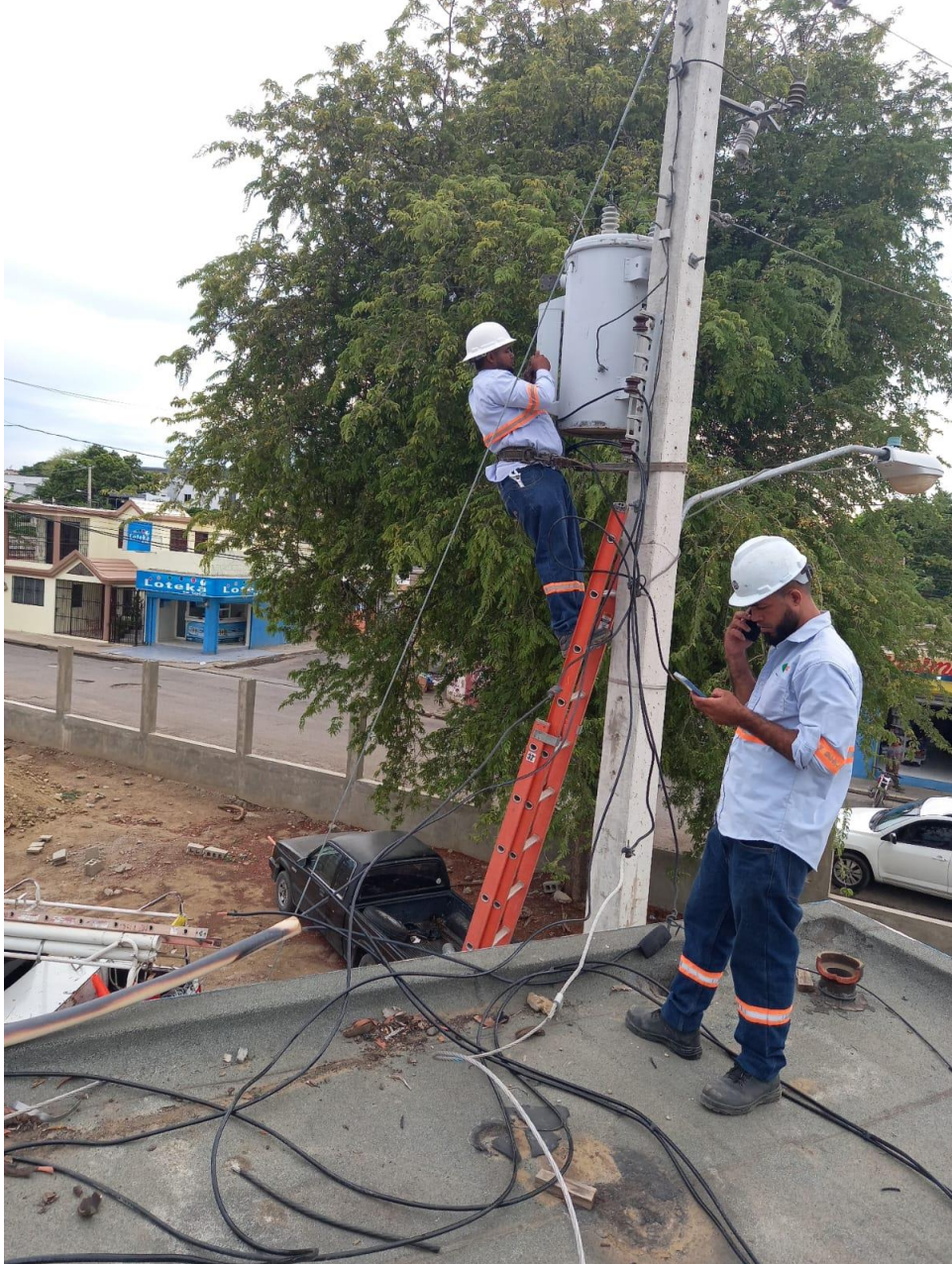
Reparación de cables eléctricos de la edificación, en fecha 14/08/2024