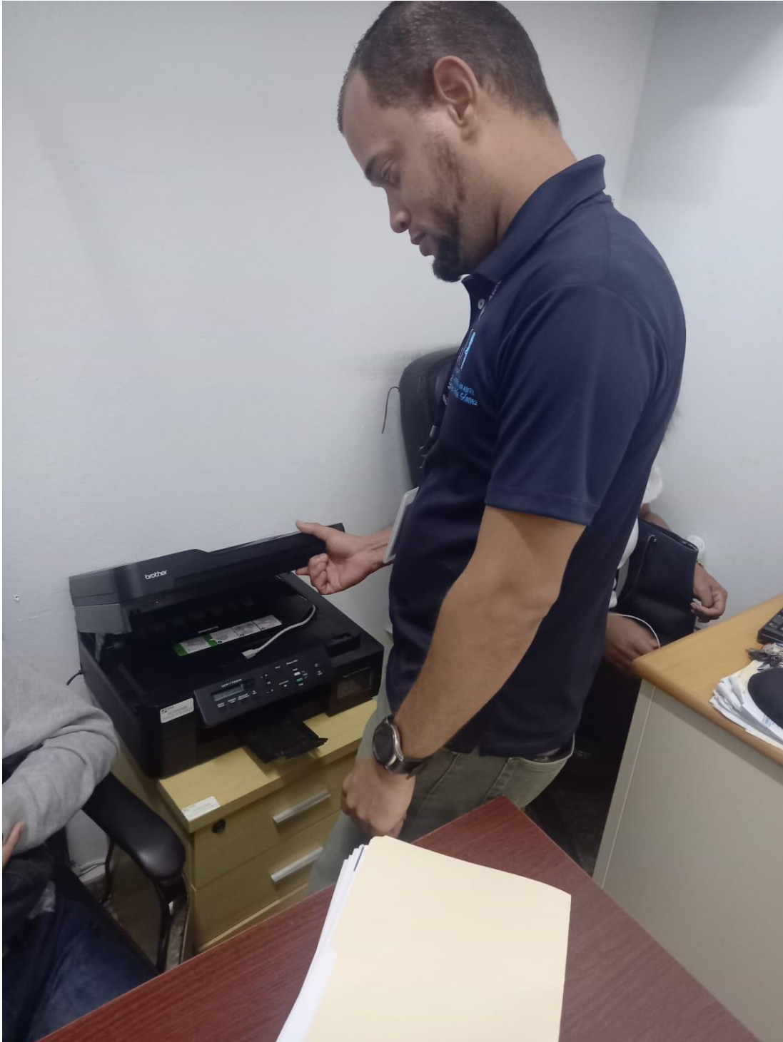
Llenado de cartucho de tinta y mantenimiento impresora de maternidad en fecha 28/08/2024.