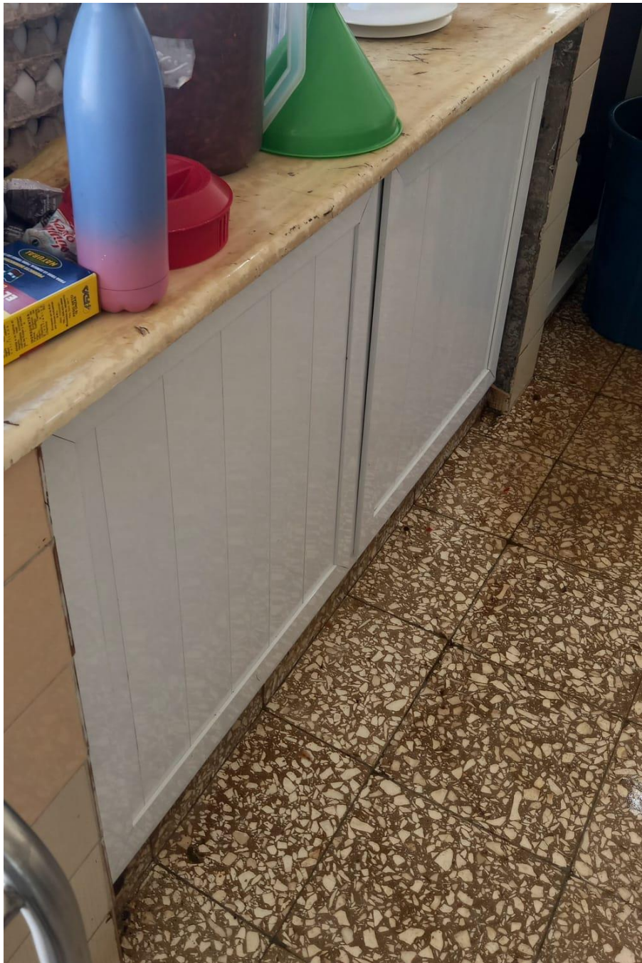
Postura de puerta de gabinete de la cocina en fecha 27/08/2024