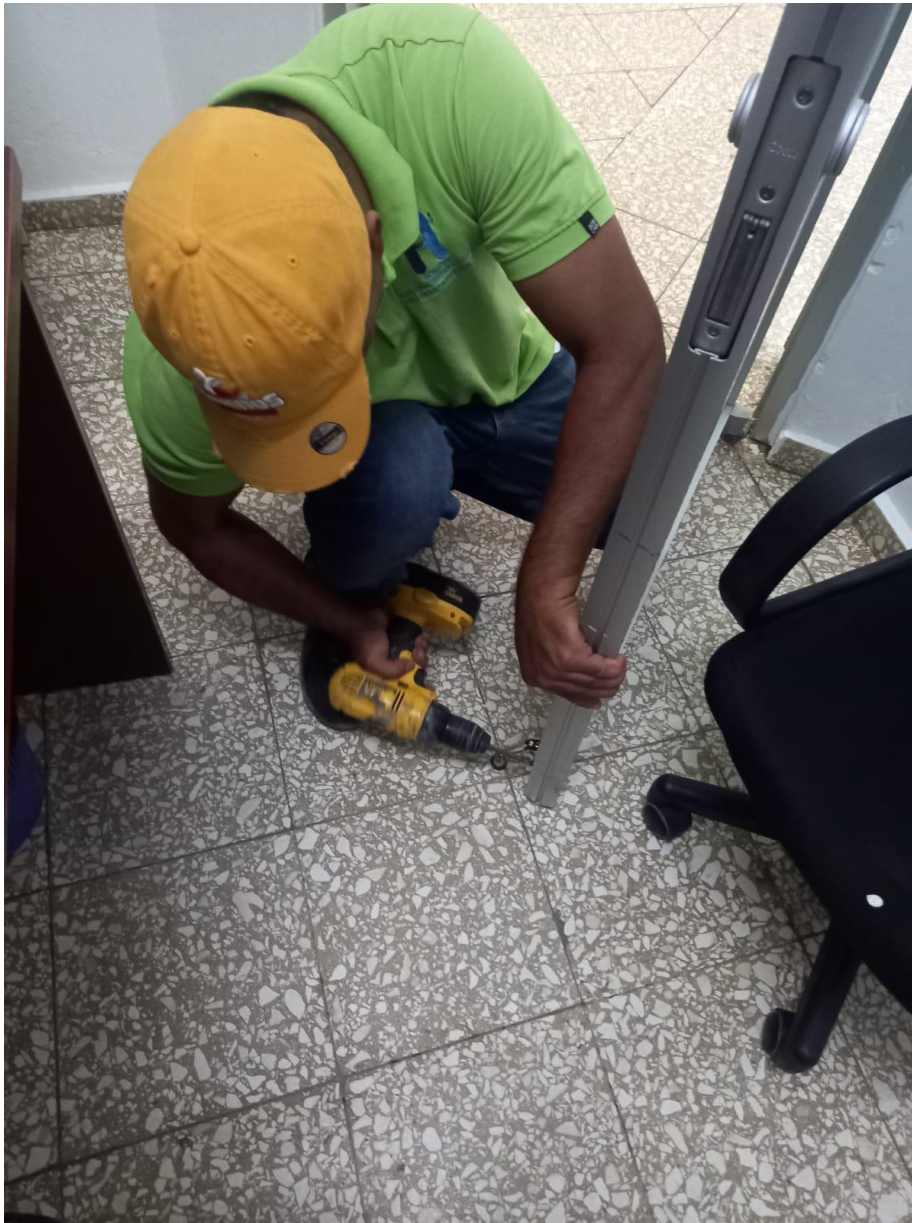
Postura patica de chivo a puerta de entrada oficina de administración en fecha 28/08/2024