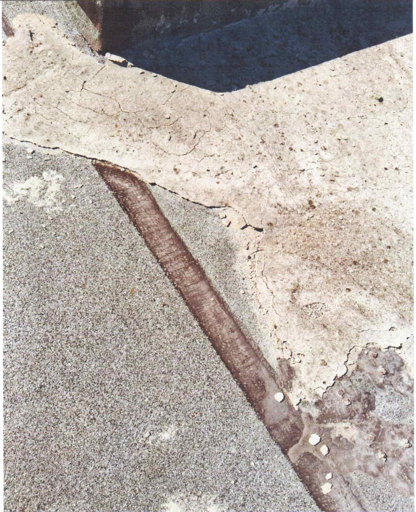
Mantenimiento Aire de Laboratorio