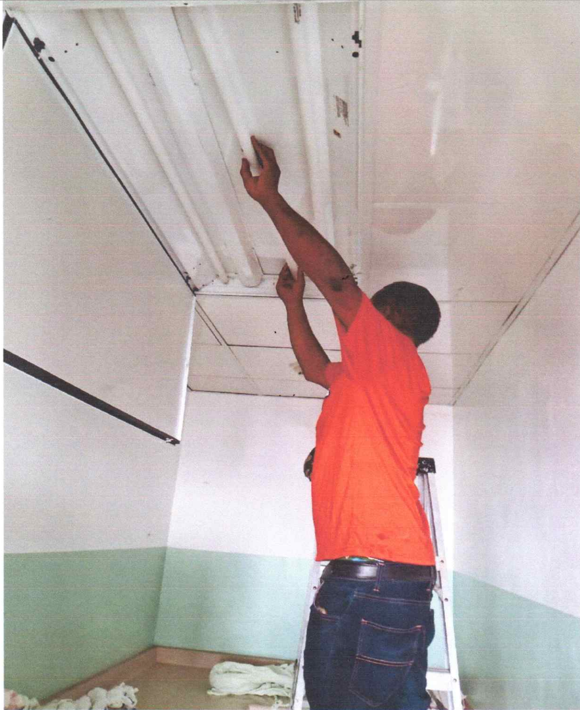
Reparación de lámpara de Cirugía