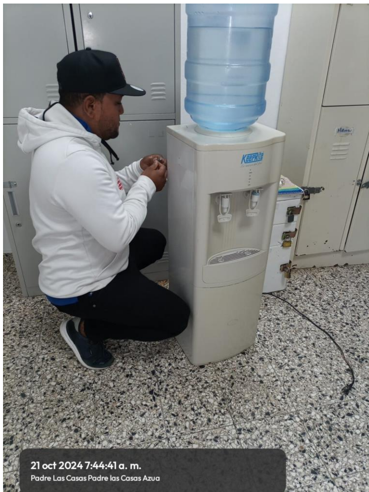
Mantenimiento correctivo de bebederos