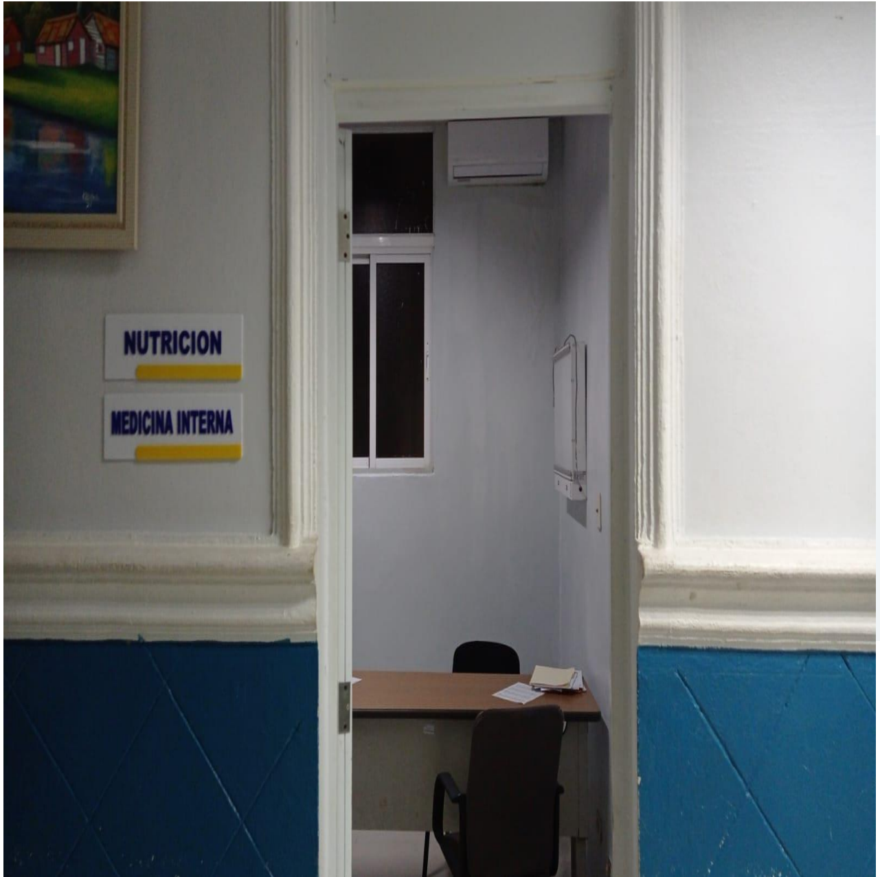
Mejoras de Infraestructura de los Consultorios de la Consulta Especializada (Ahora)