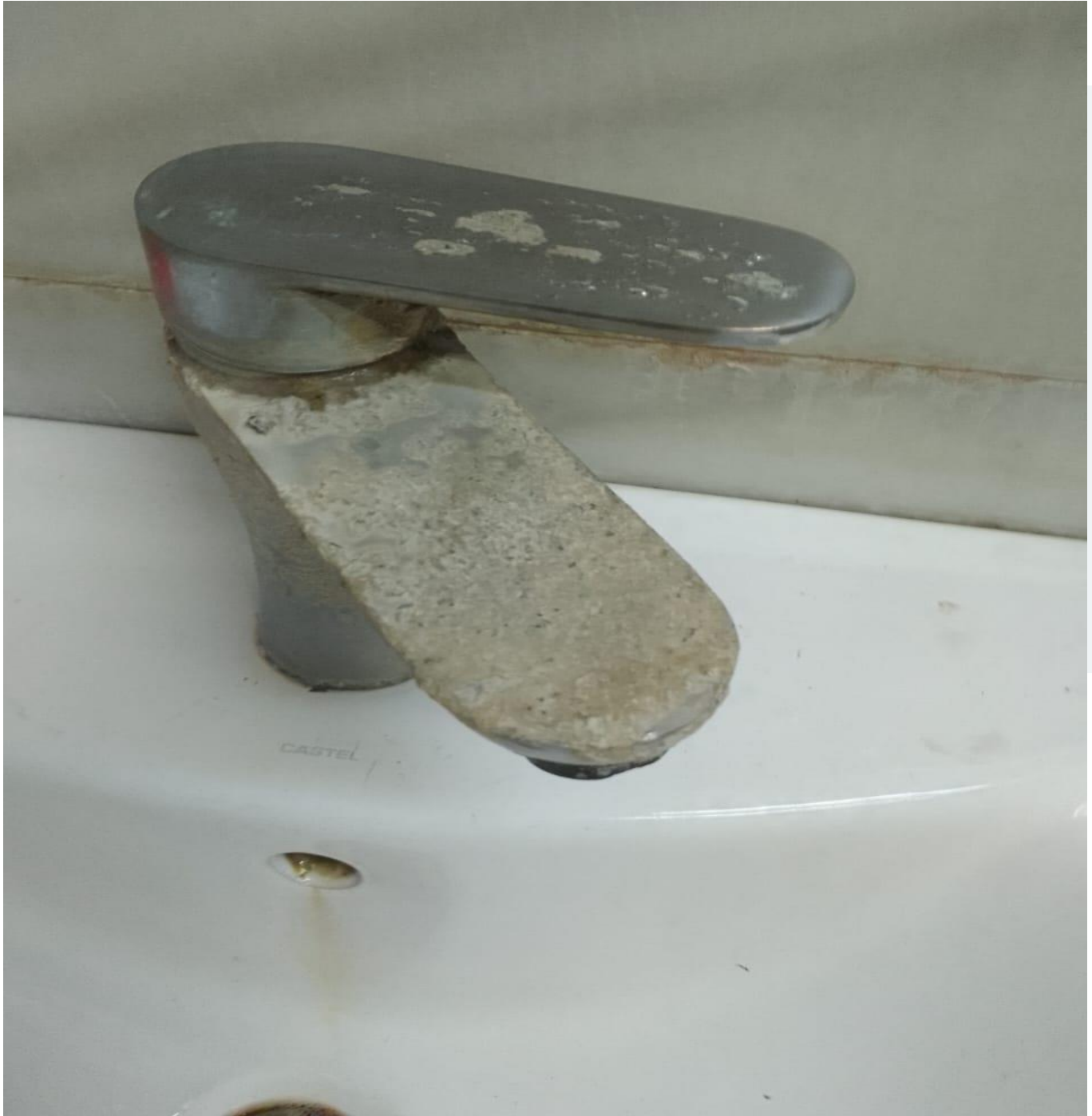
Cambio de llaves de algunas áreas (Antes)