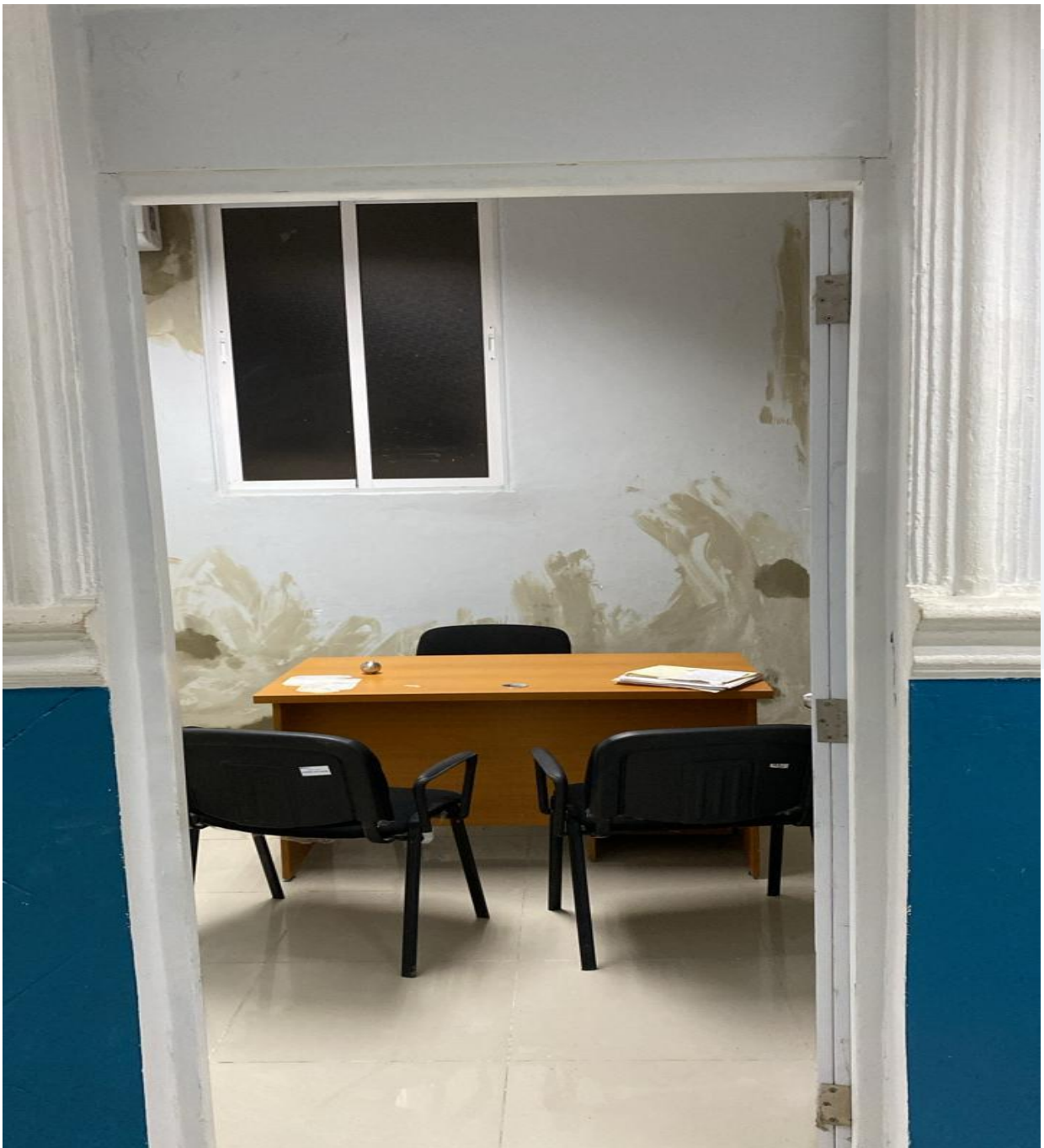
Mejoras de Infraestructura de los Consultorios de la Consulta Especializada (Durante)