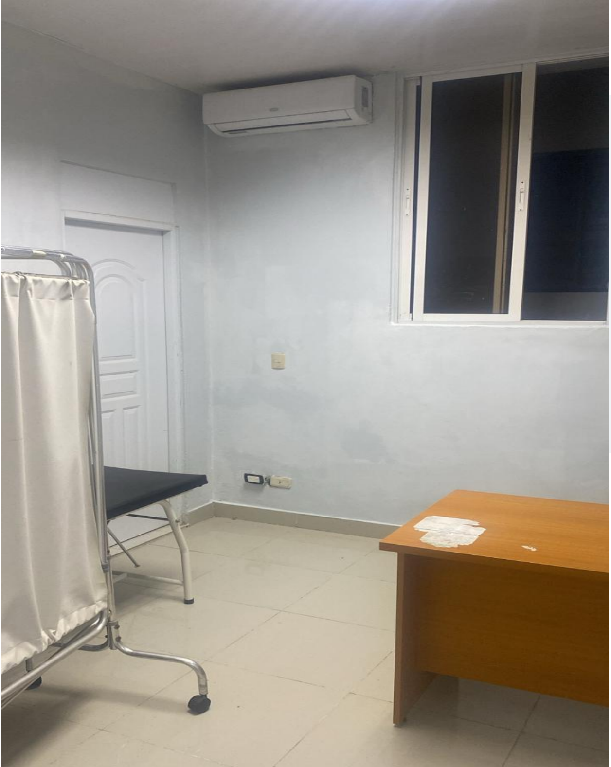
Mejoras de Infraestructura de los Consultorios de la Consulta Especializada (Ahora)