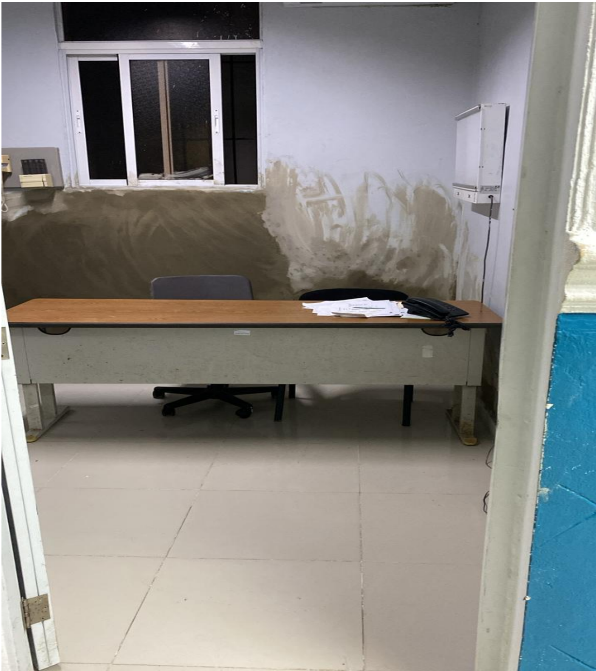
Mejoras de Infraestructura de los Consultorios de la Consulta Especializada (Durante)