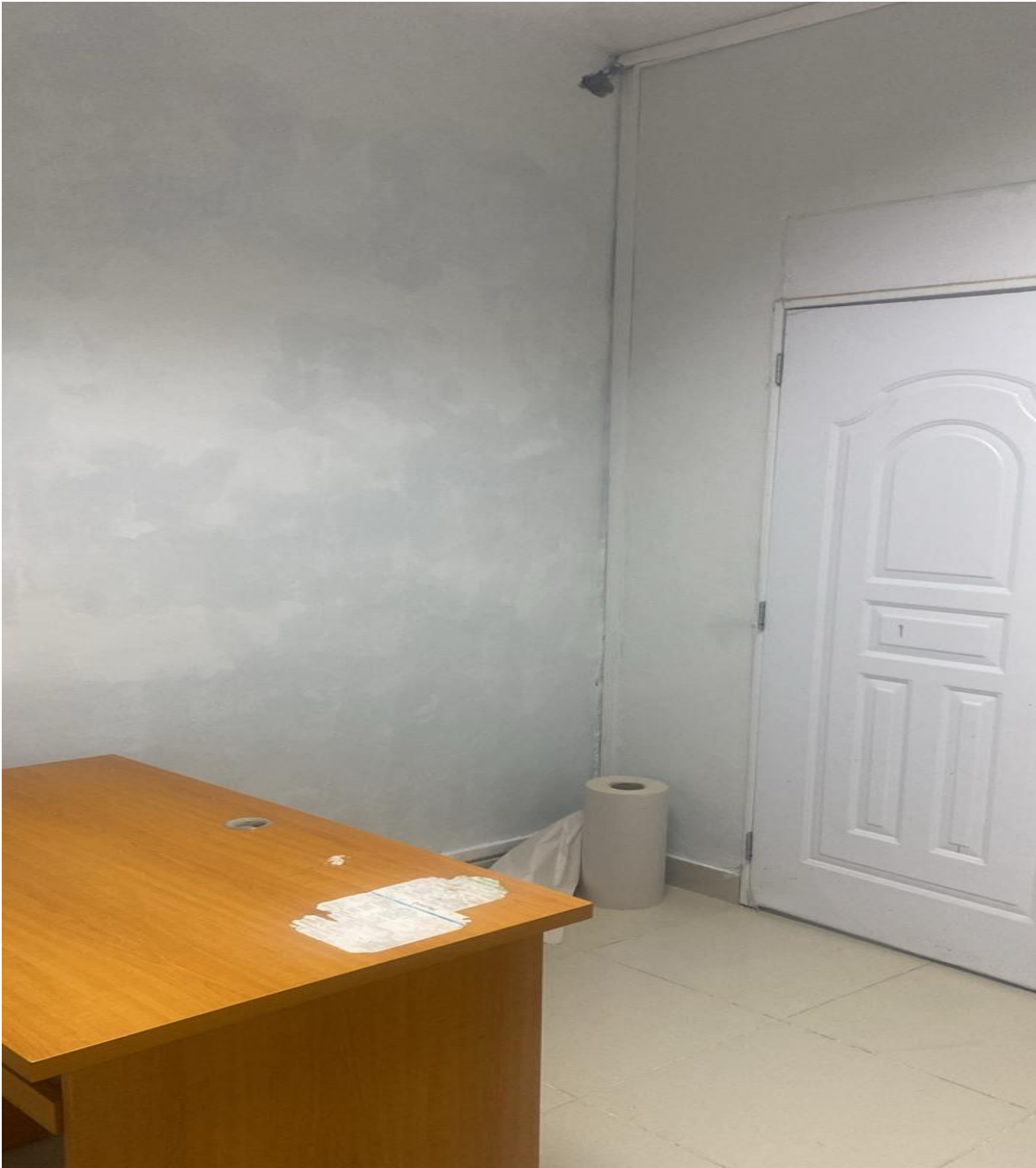
Mejoras de Infraestructura de los Consultorios de la Consulta Especializada (Ahora)