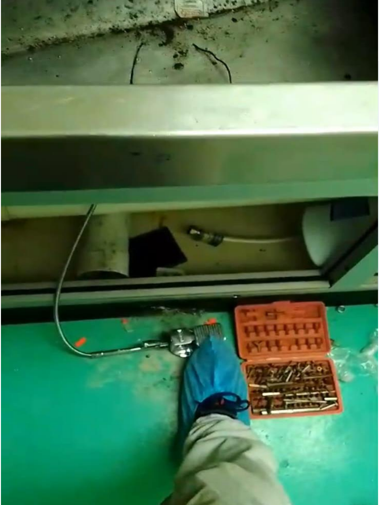
Cambio de llaves de algunas áreas (Durante)