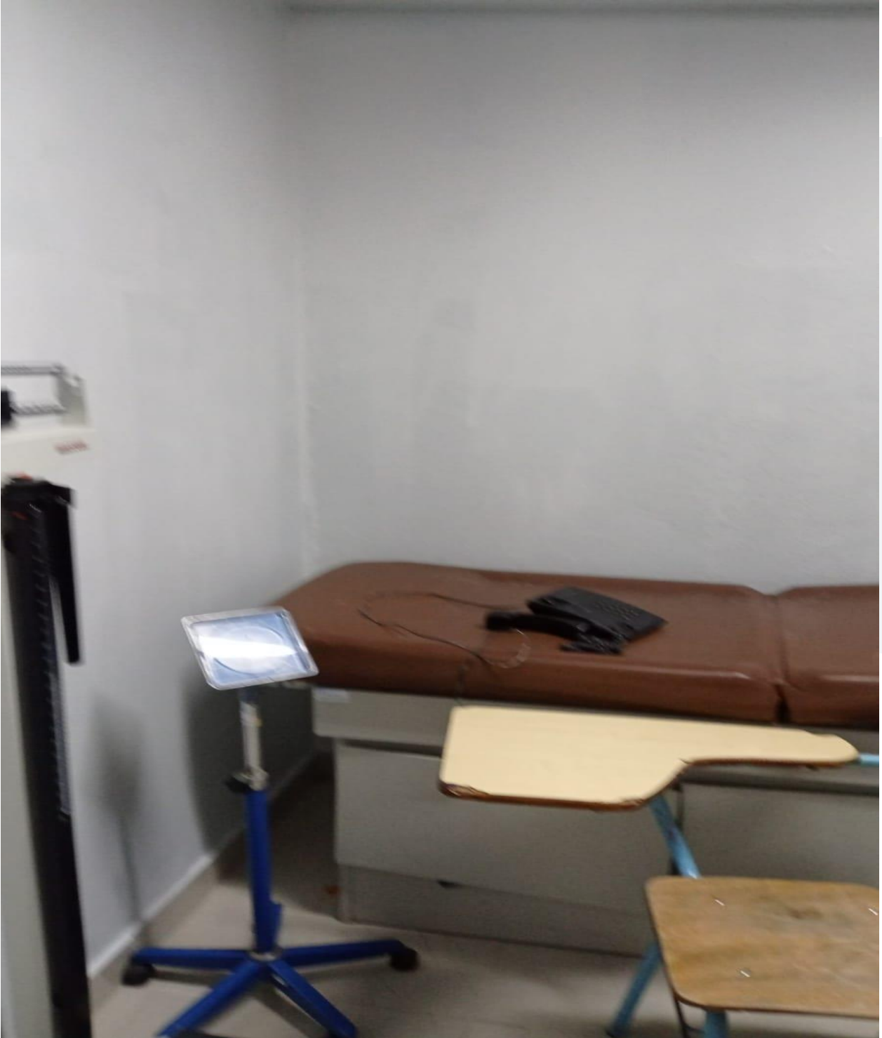
Mejoras de Infraestructura de los Consultorios de la Consulta Especializada (Ahora)