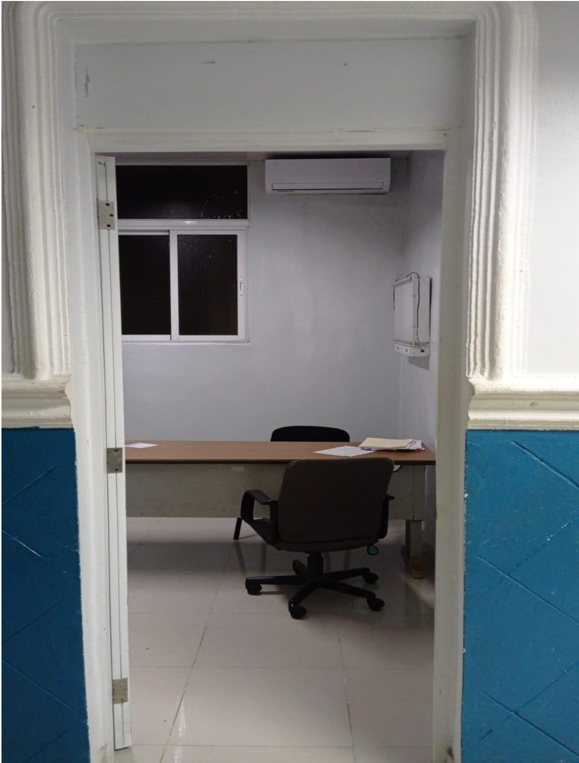
Mejoras de Infraestructura de los Consultorios de la Consulta Especializada (Ahora)