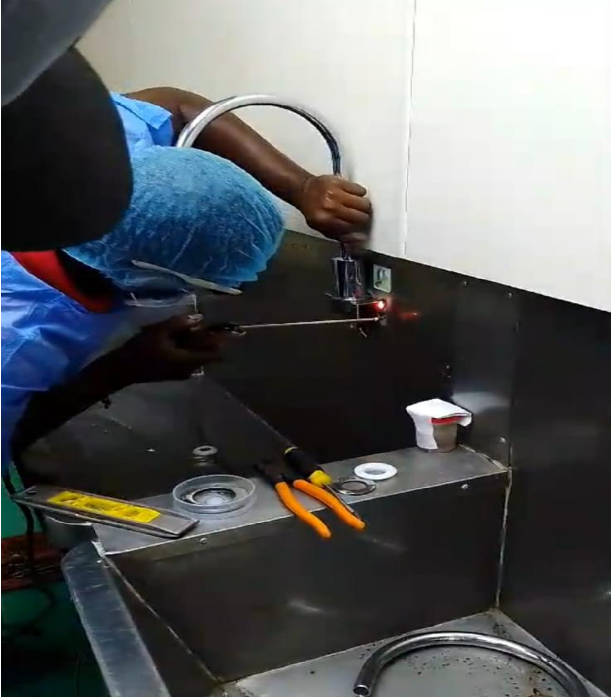
Cambio de llaves de algunas áreas (Durante)