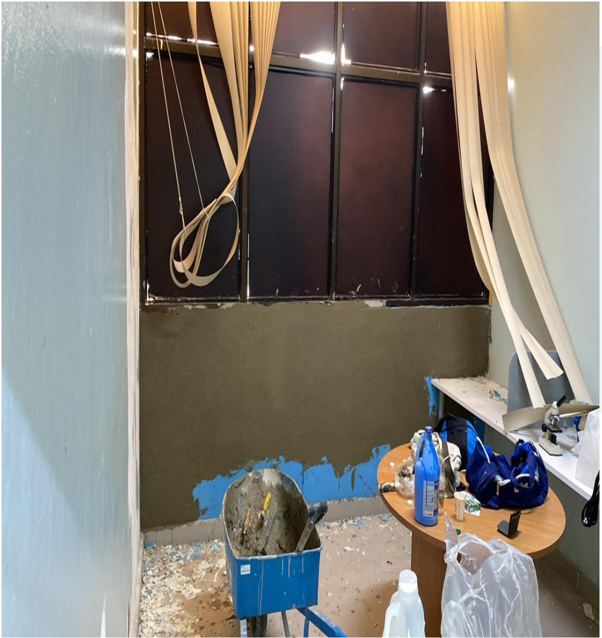
Mejoras en Infraestructura Área de Simulación (Durante)