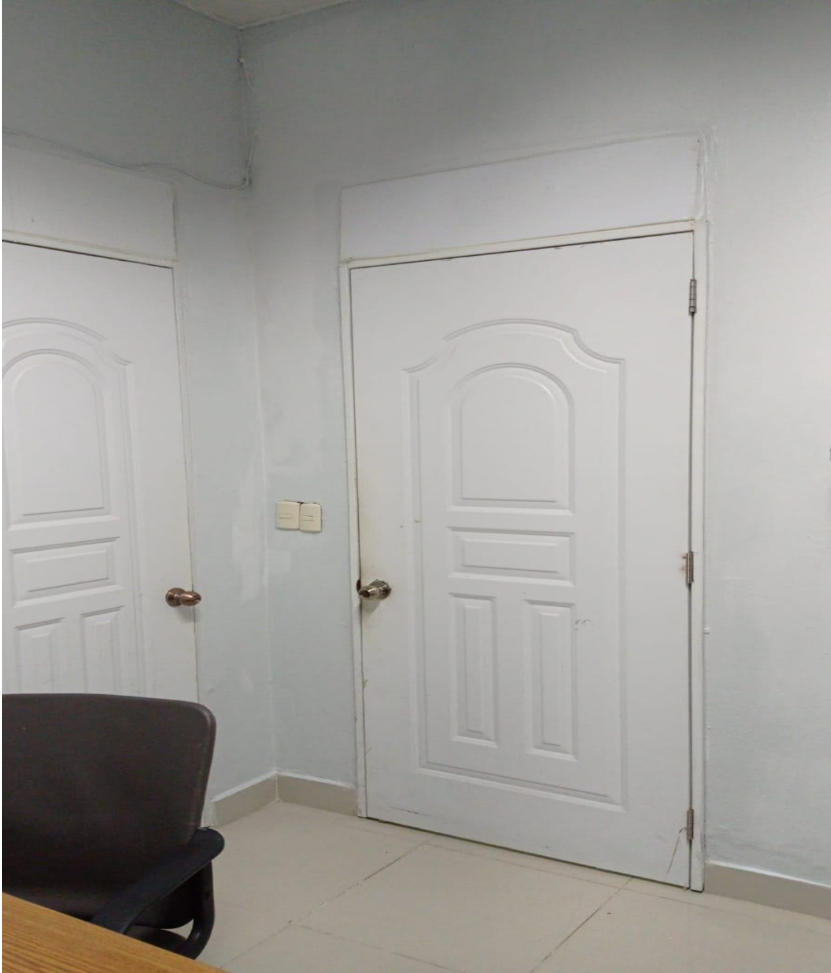
Mejoras de Infraestructura de los Consultorios de la Consulta Especializada (Ahora)