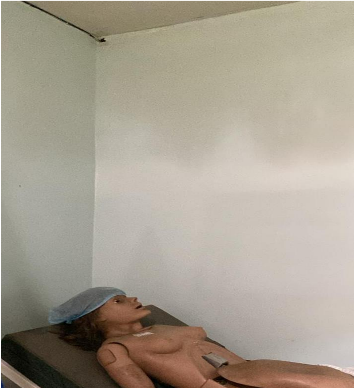
Mejoras en Infraestructura Área de Simulación (Ahora)