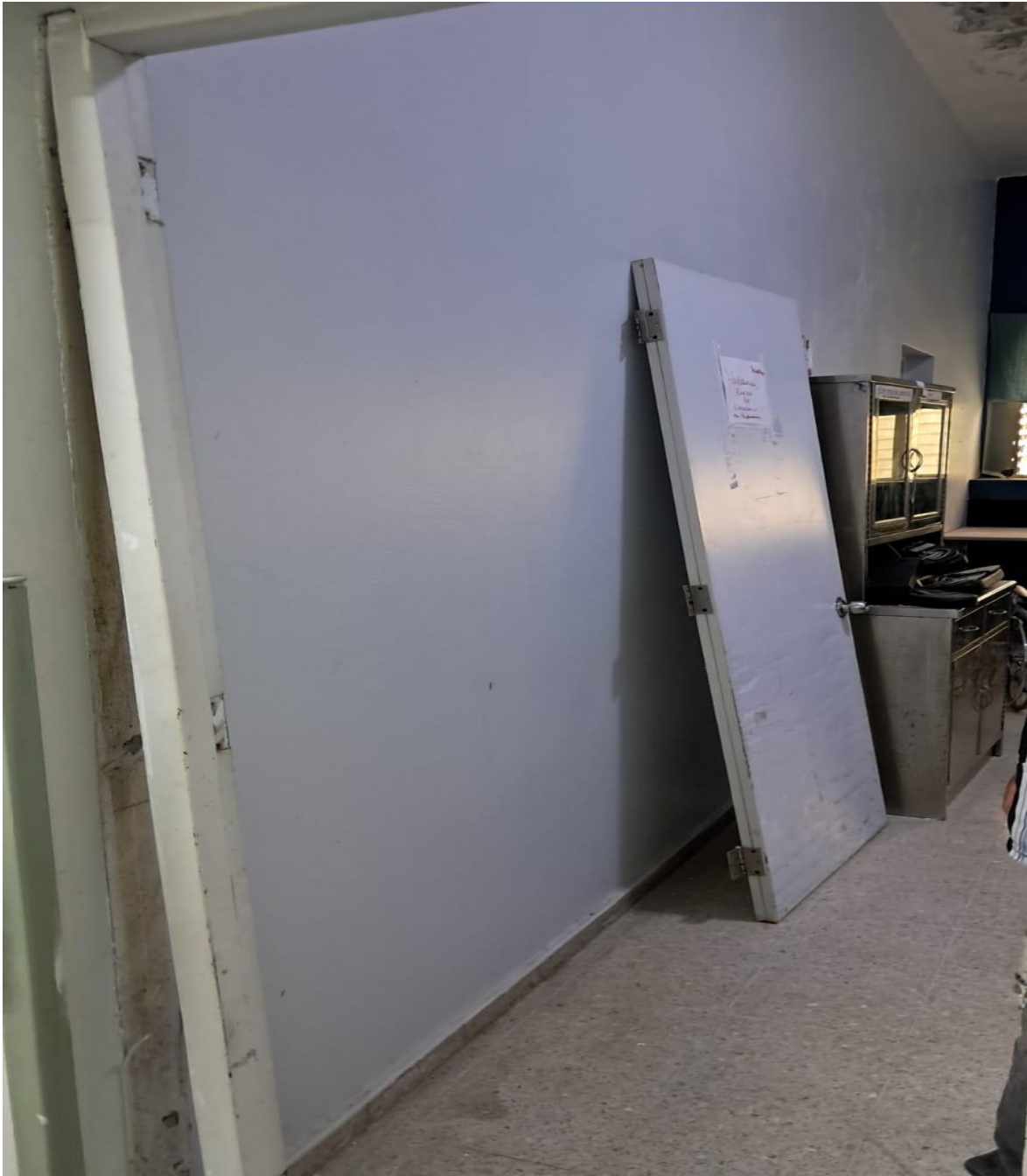
Colocación de puertas en habitaciones del segundo y tercer nivel de la maternidad (Durante)