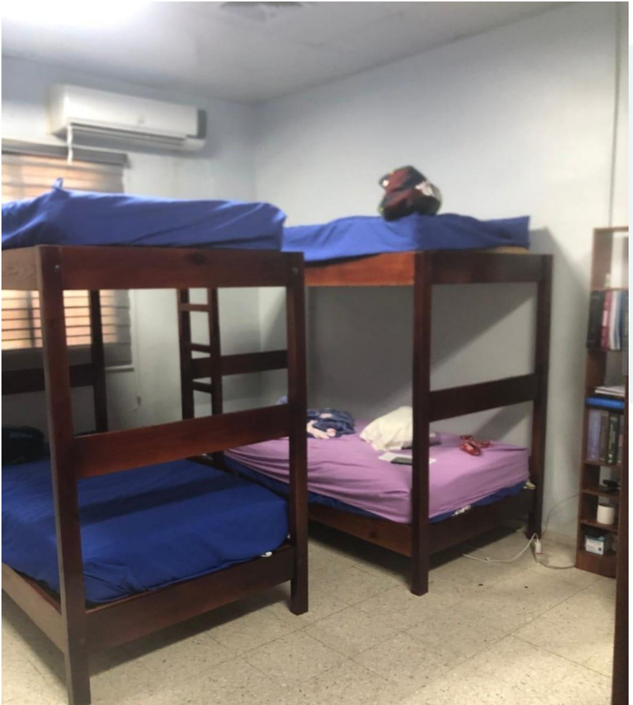
Adquisición de Camas de Dormitorios residentes de Anestesiología