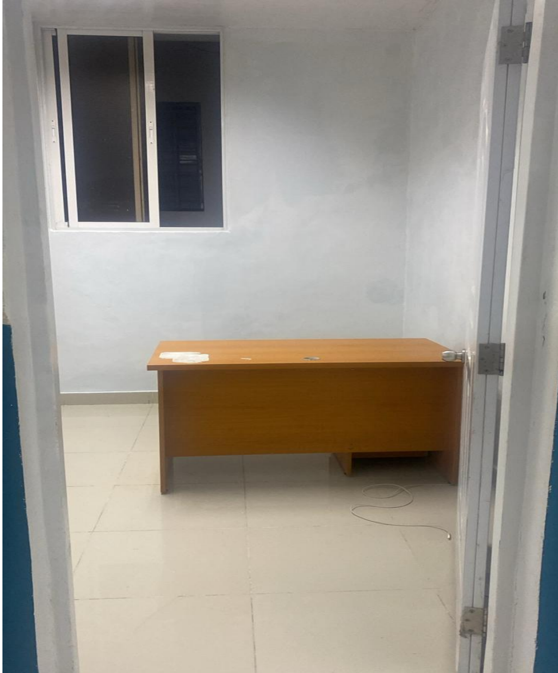
Mejoras de Infraestructura de los Consultorios de la Consulta Especializada (Ahora)