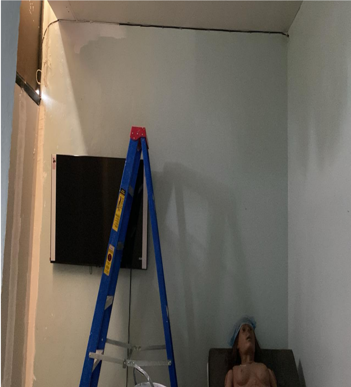
Mejoras en Infraestructura Área de Simulación (Durante)