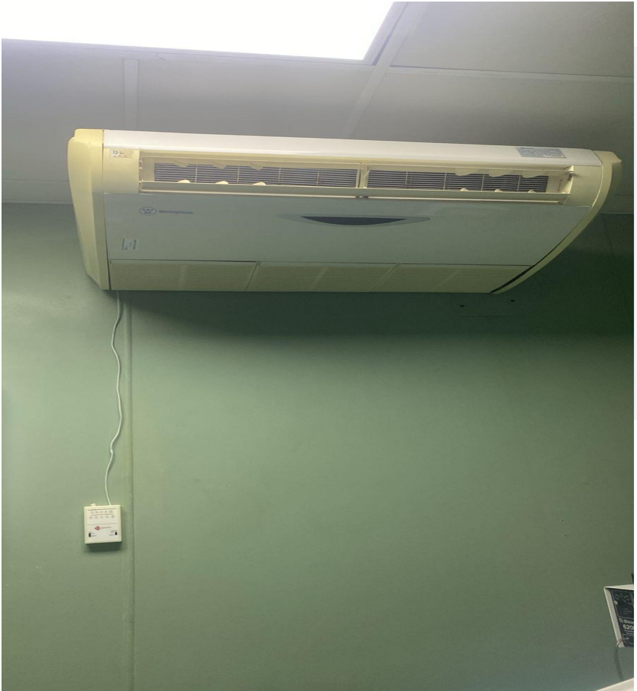
Colocación de Aires Acondicionados en diferentes Áreas