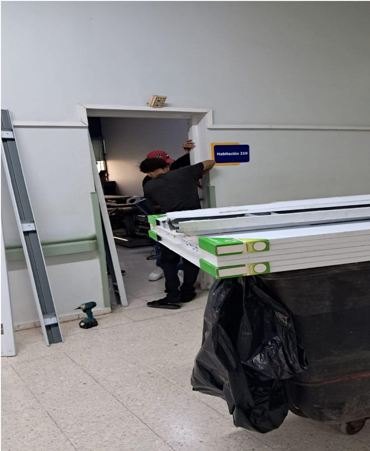
Colocación de puertas en habitaciones del segundo y tercer nivel de la maternidad (Durante)