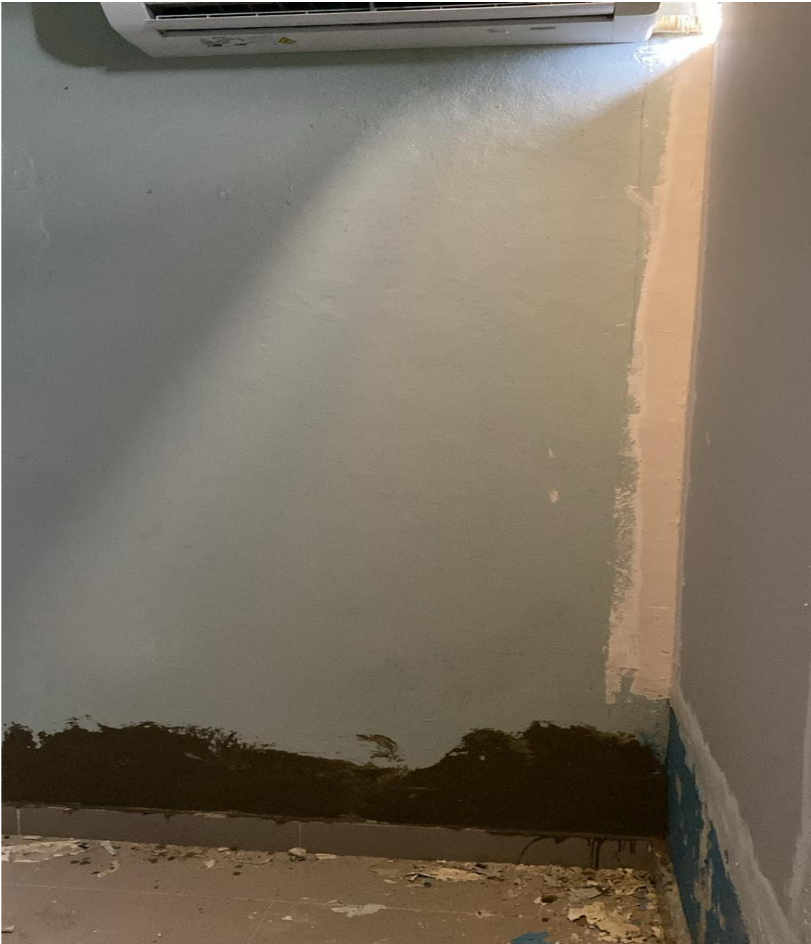
Mejoras en Infraestructura Área de Simulación (Durante)