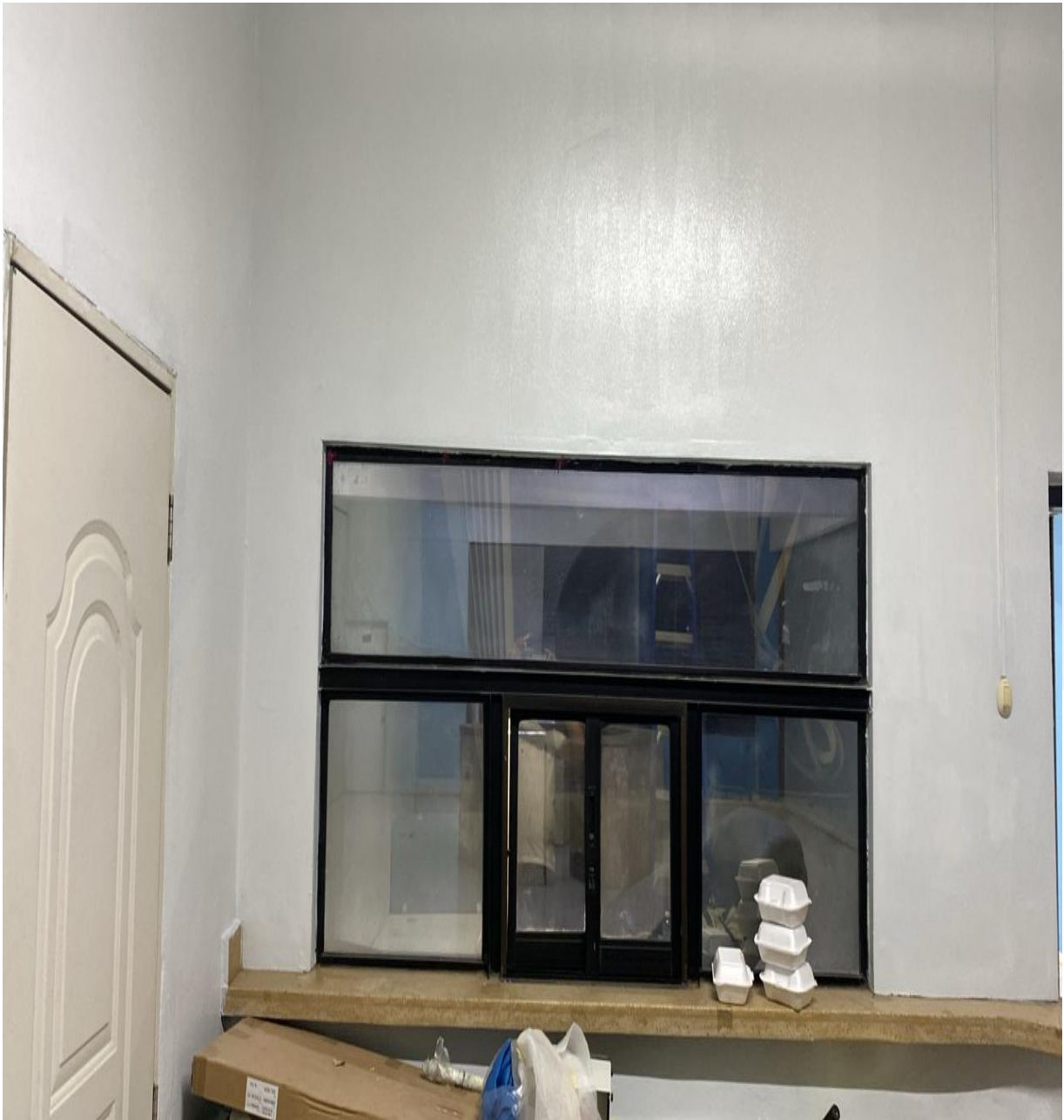
Mejoras en Infraestructura Área de Simulación (Ahora)