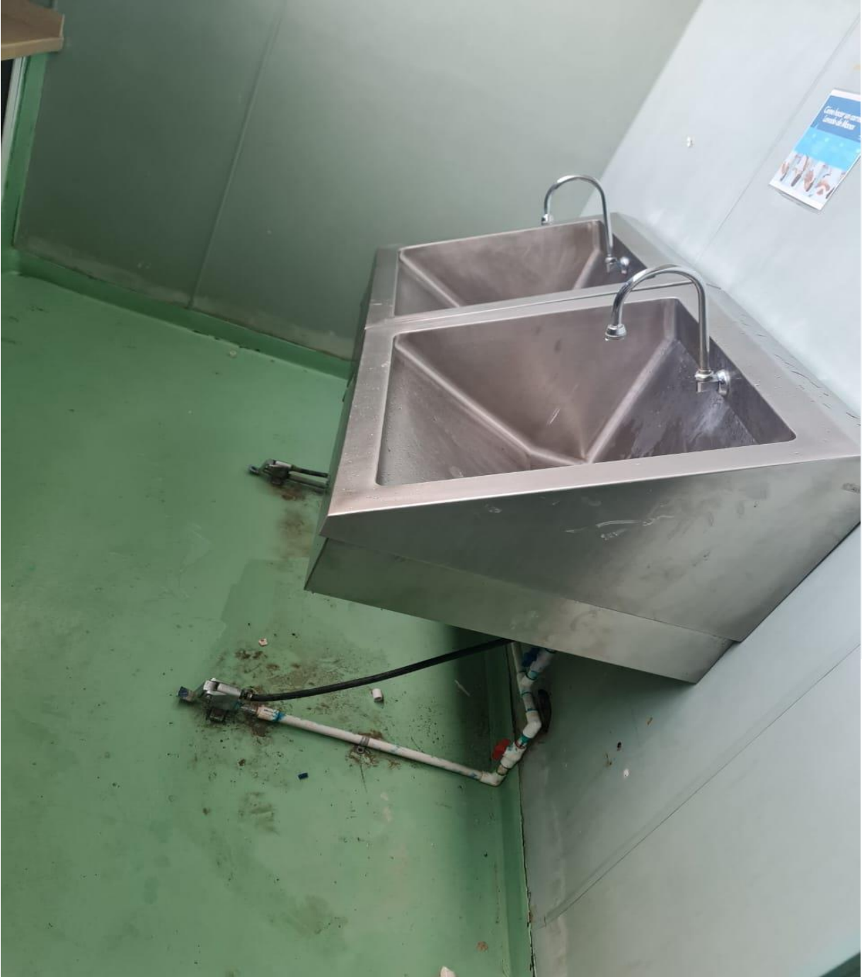
Cambio de llaves de algunas áreas (Ahora)