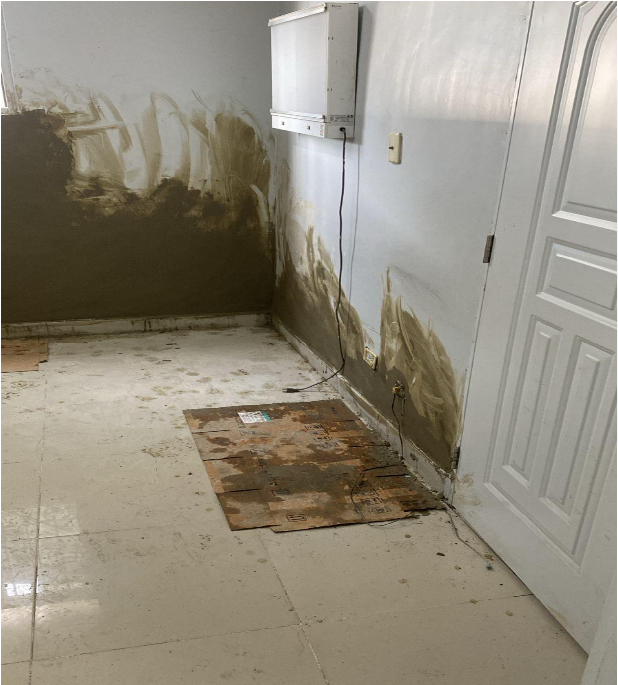
Mejoras de Infraestructura de los Consultorios de la Consulta Especializada (Durante)