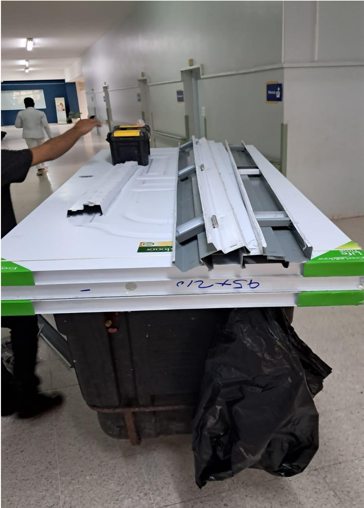
Colocación de puertas en habitaciones del segundo y tercer nivel de la maternidad (Durante)