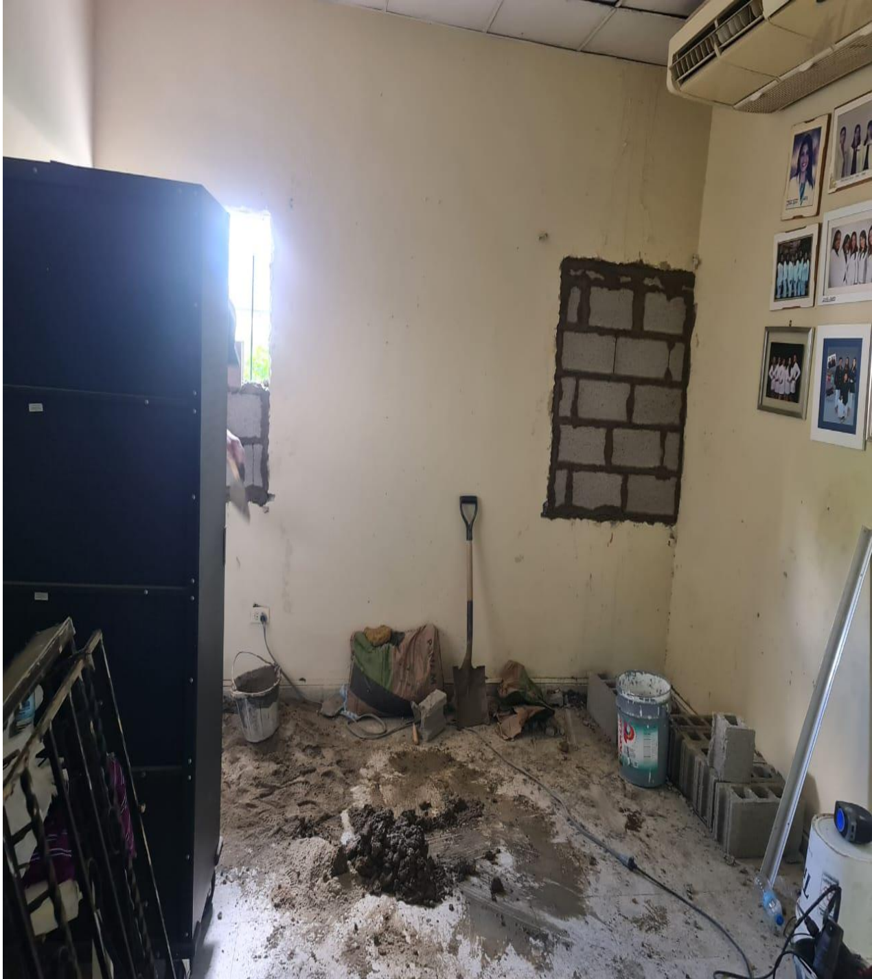
Mejoras de Área para Central de Mezcla Neonatal (Durante)