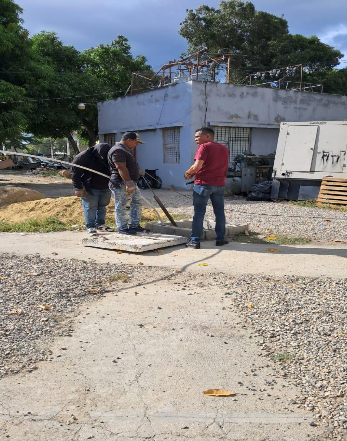
Mantenimiento de Registros de Aguas Residuales