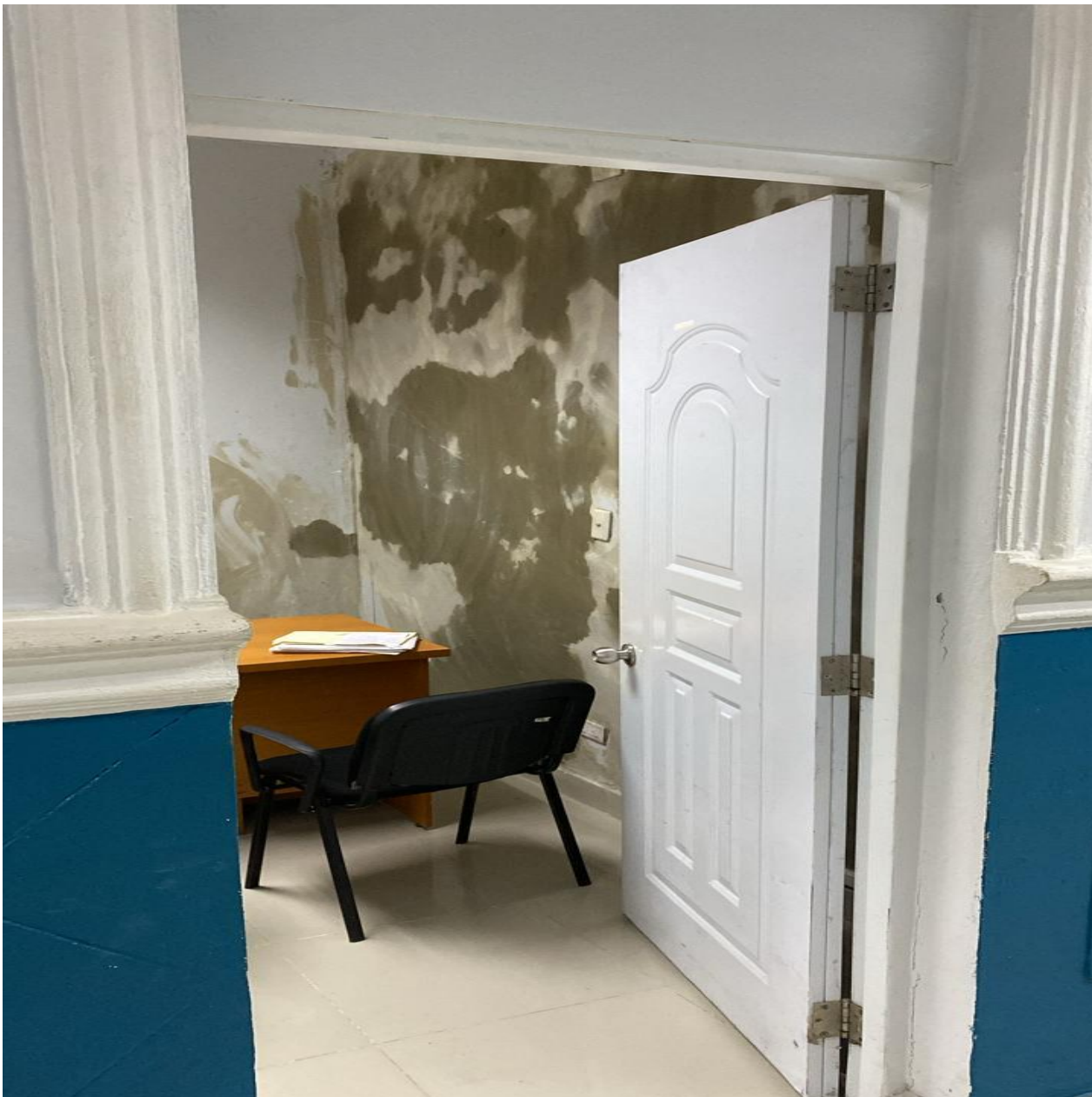
Mejoras de Infraestructura de los Consultorios de la Consulta Especializada (Durante)