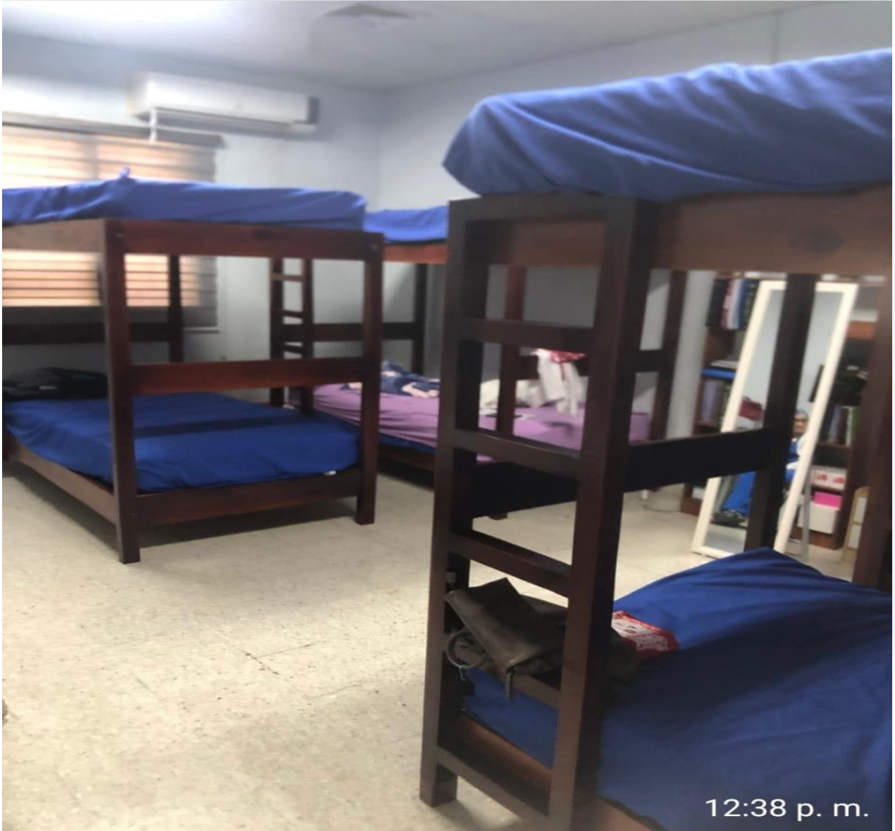
Adquisición de Camas de Dormitorios residentes de Anestesiología