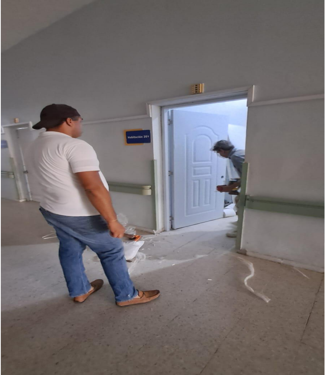
Colocación de puertas en habitaciones del segundo y tercer nivel de la maternidad (Durante)