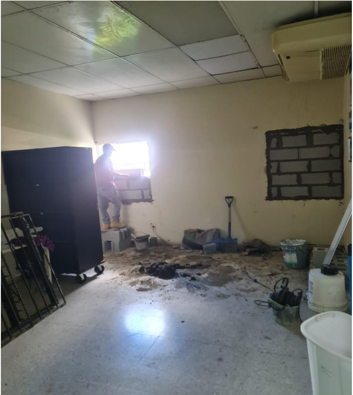
Mejoras de Área para Central de Mezcla Neonatal (Durante)