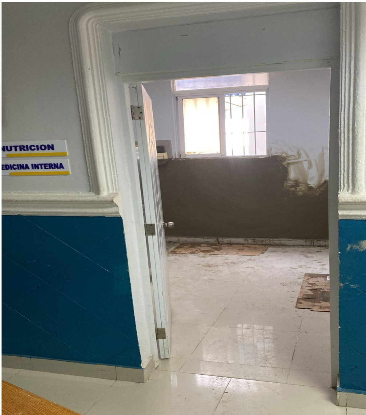
Mejoras de Infraestructura de los Consultorios de la Consulta Especializada (Durante)