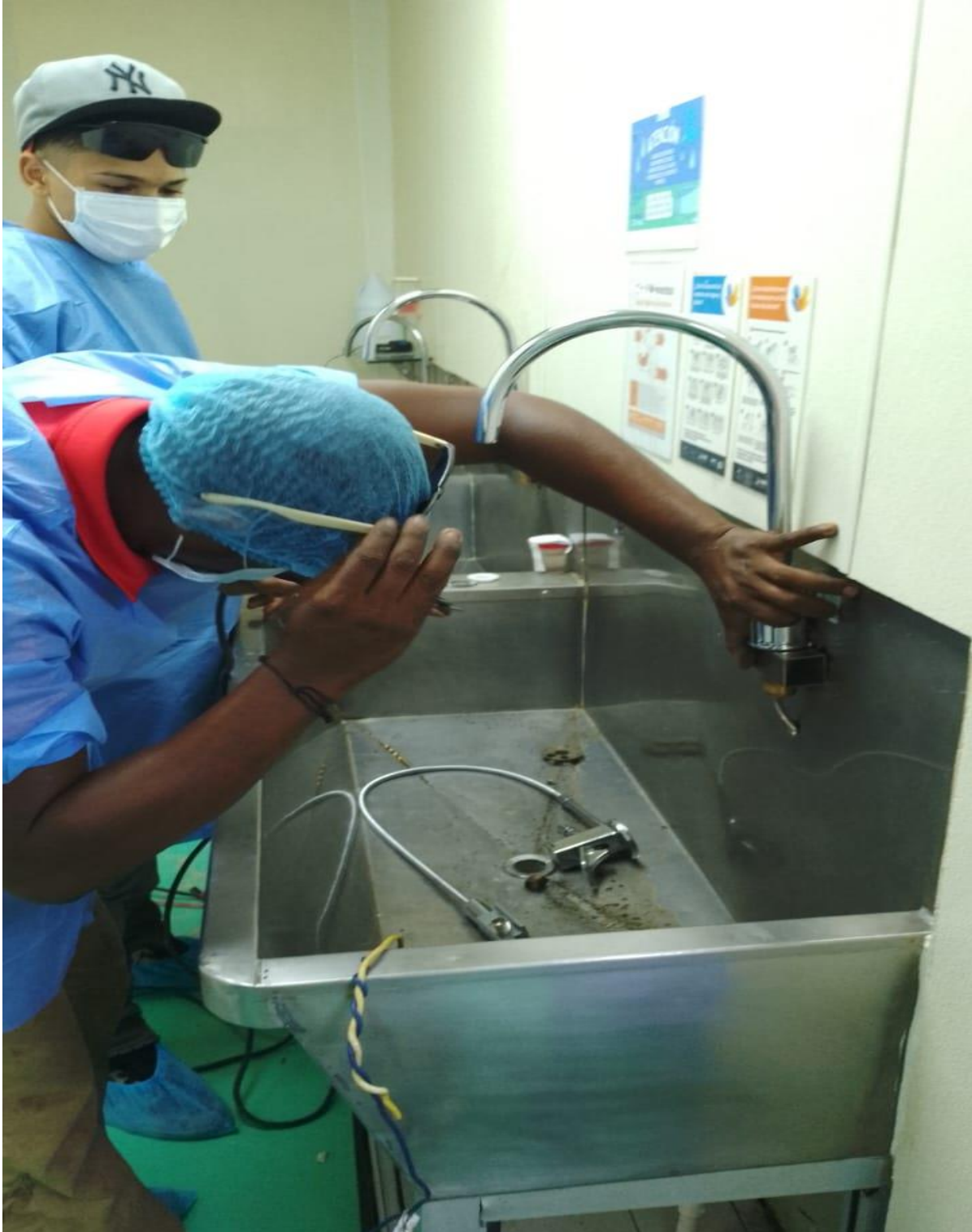
Cambio de llaves de algunas áreas (Durante)