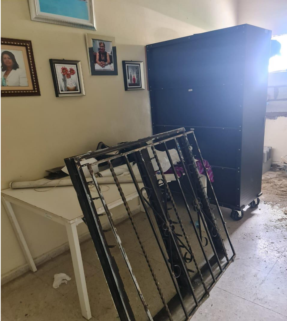
Mejoras de Área para Central de Mezcla Neonatal (Durante)