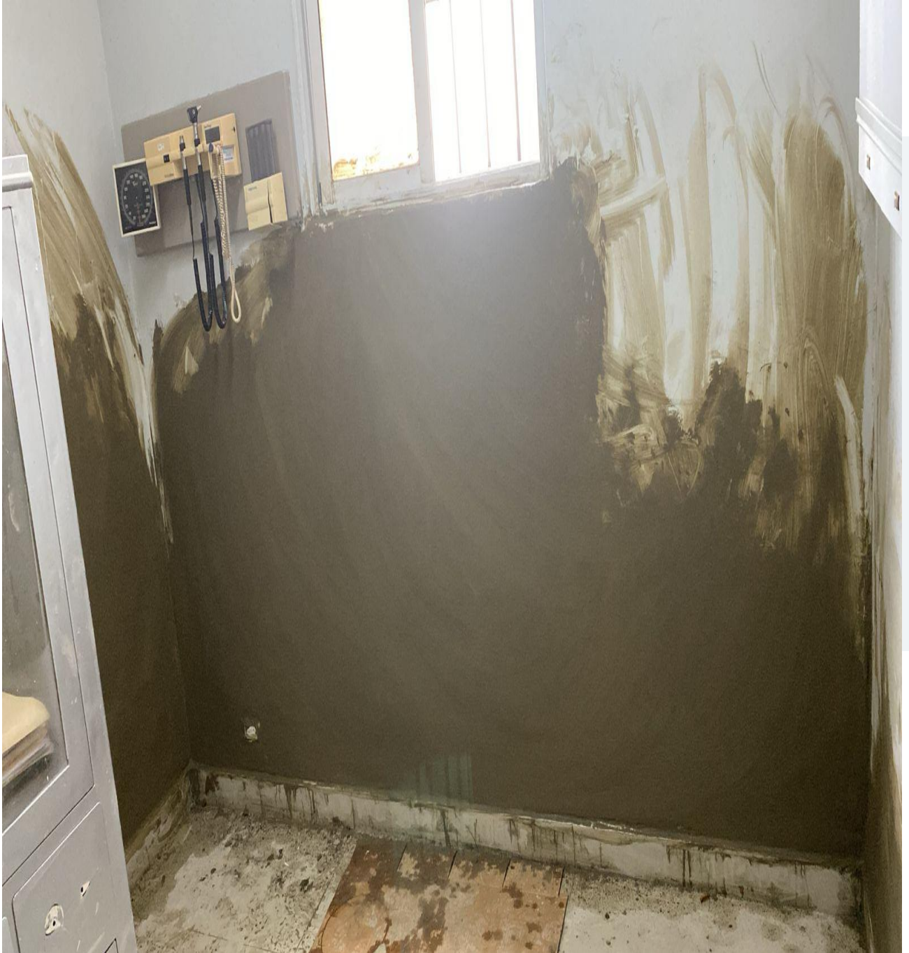
Mejoras de Infraestructura de los Consultorios de la Consulta Especializada (Durante)