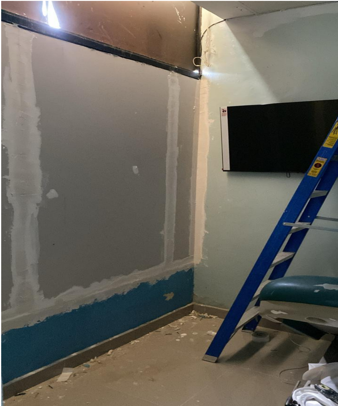
Mejoras en Infraestructura Área de Simulación (Durante)