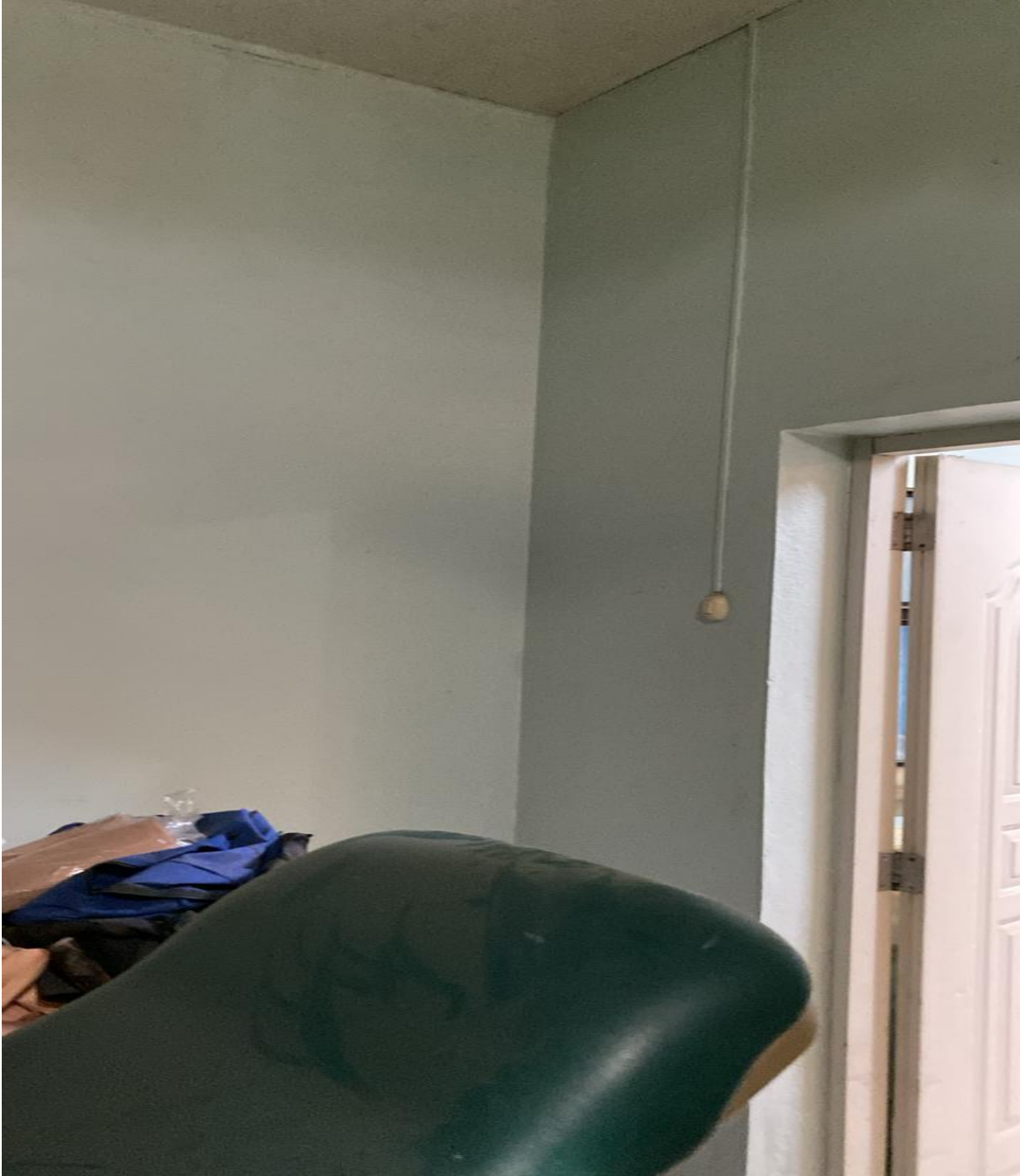
Mejoras en Infraestructura Área de Simulación (Ahora)