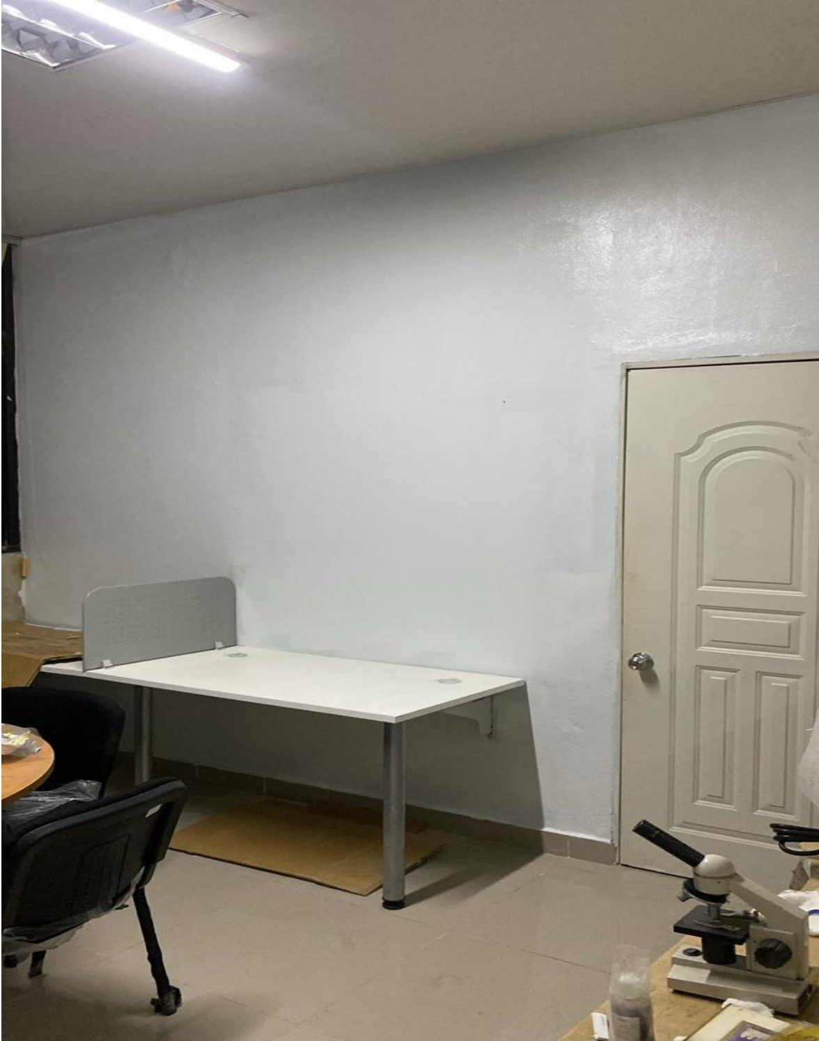
Mejoras en Infraestructura Área de Simulación (Ahora)