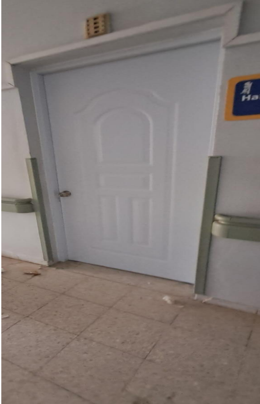
Colocación de puertas en habitaciones del segundo y tercer nivel de la maternidad (Ahora)