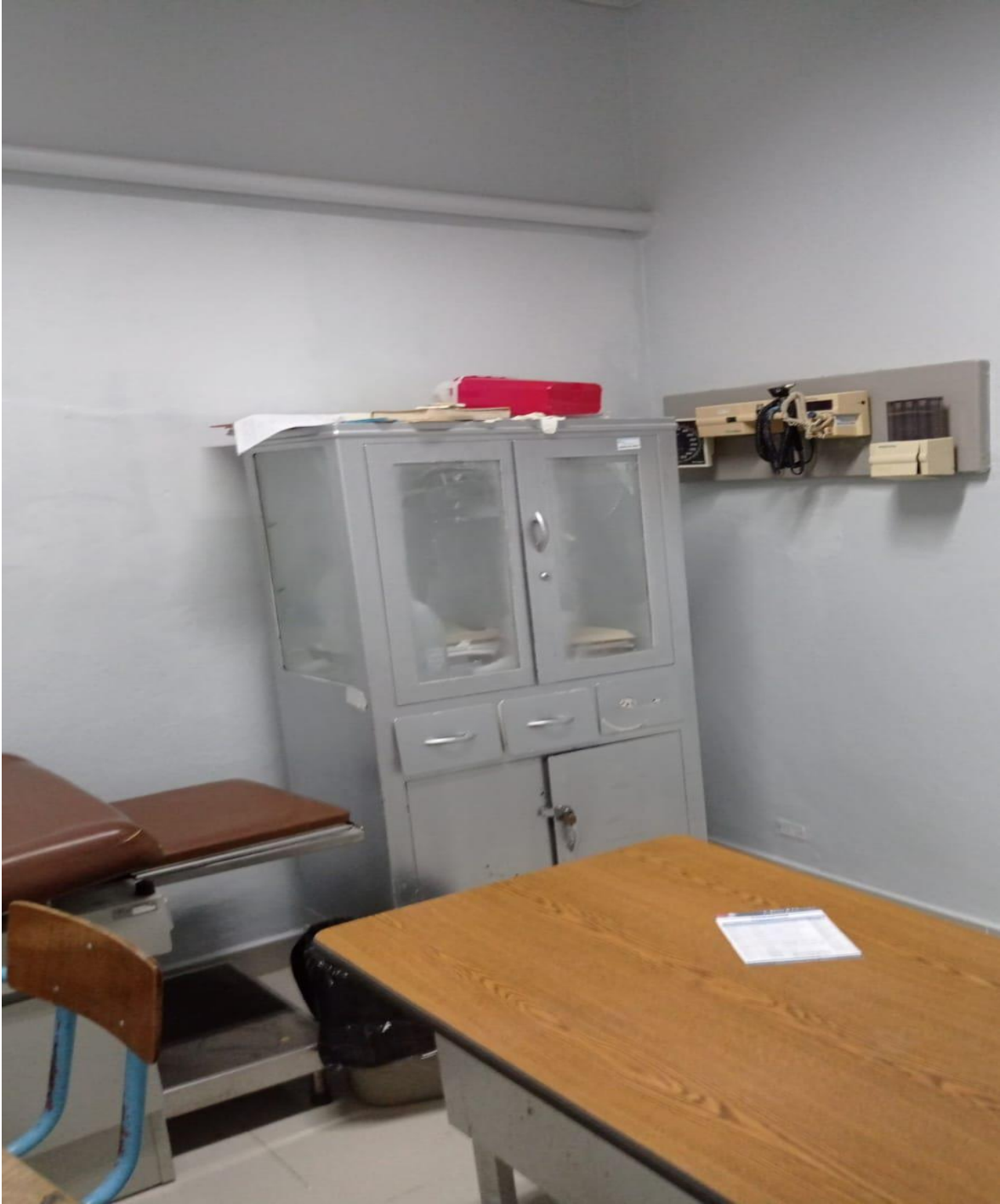
Mejoras de Infraestructura de los Consultorios de la Consulta Especializada (Ahora)