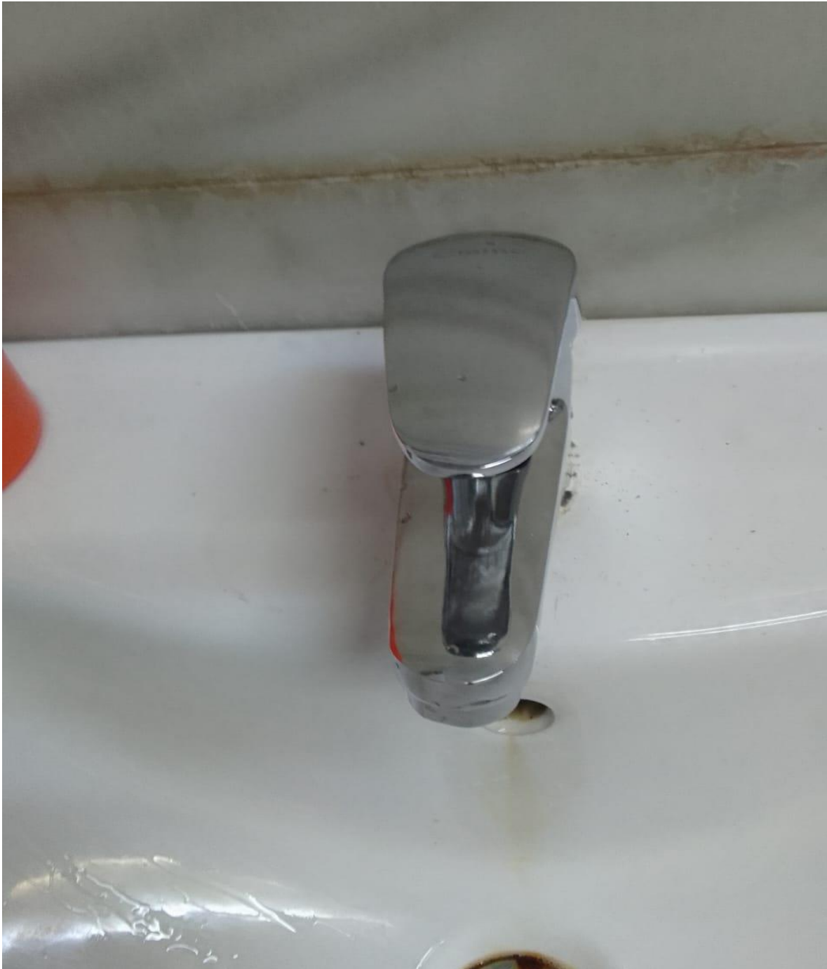
Cambio de llaves de algunas áreas (Antes)