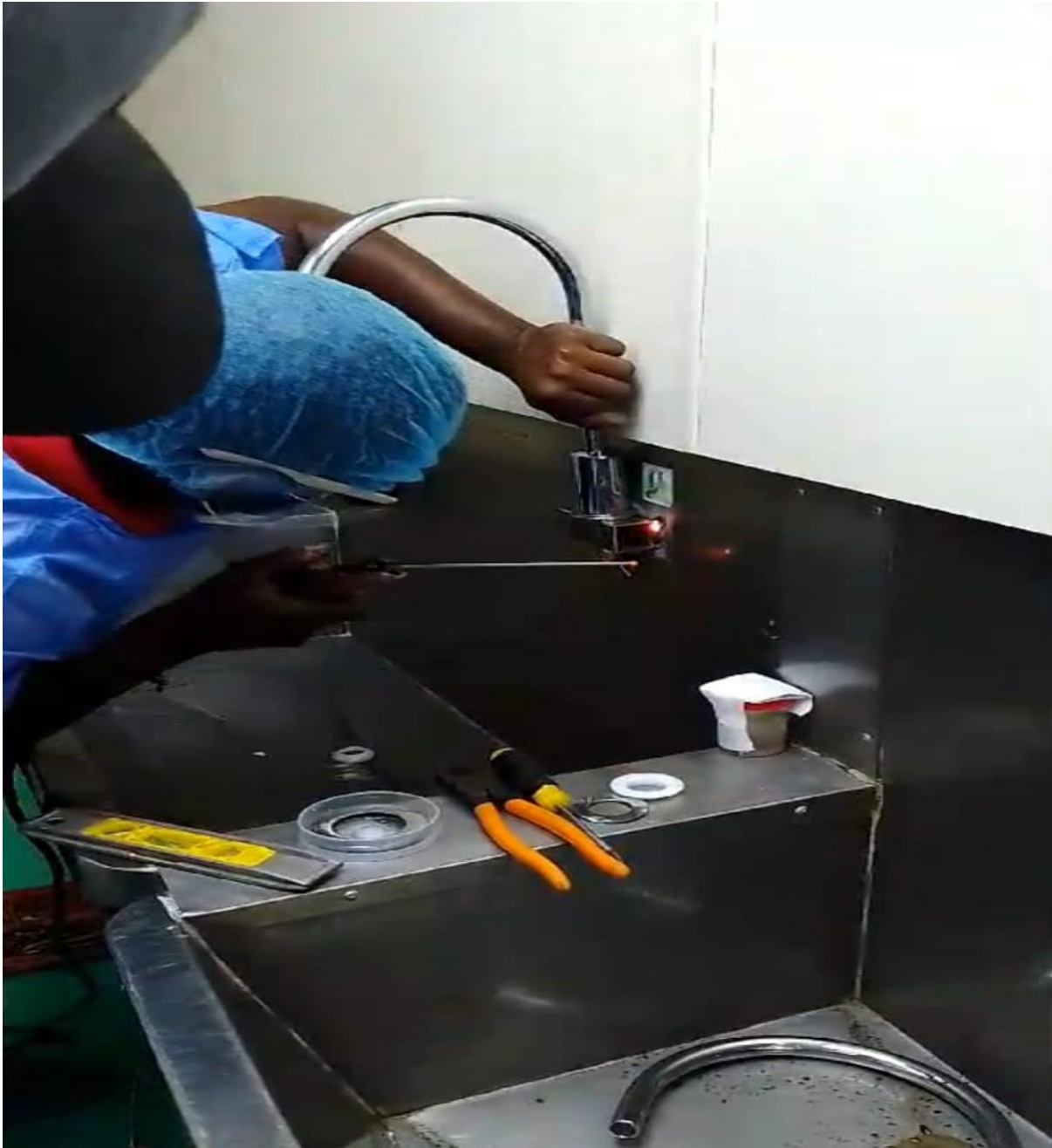
Cambio de llaves de algunas áreas (Durante)