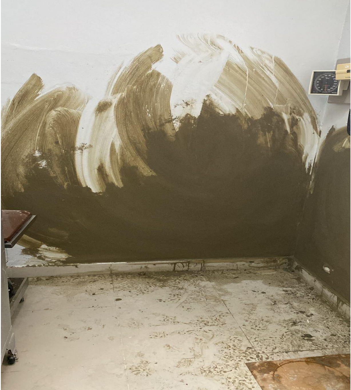
Mejoras de Infraestructura de los Consultorios de la Consulta Especializada (Durante)