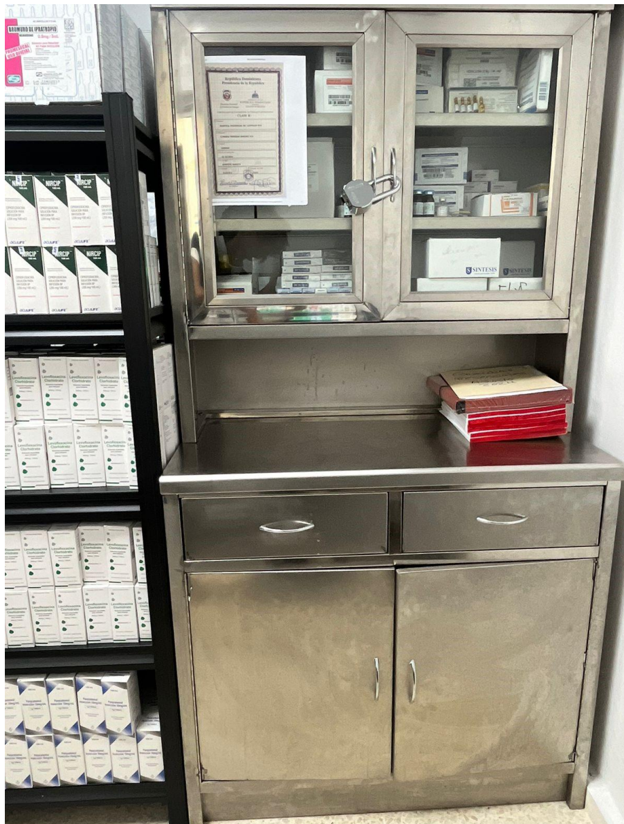
(Ilustración 11) Medicamentos controlados