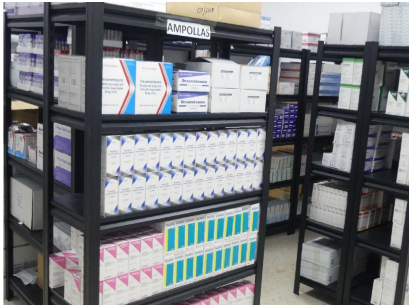
(Ilustración 3) Almacenamiento de Ampollas