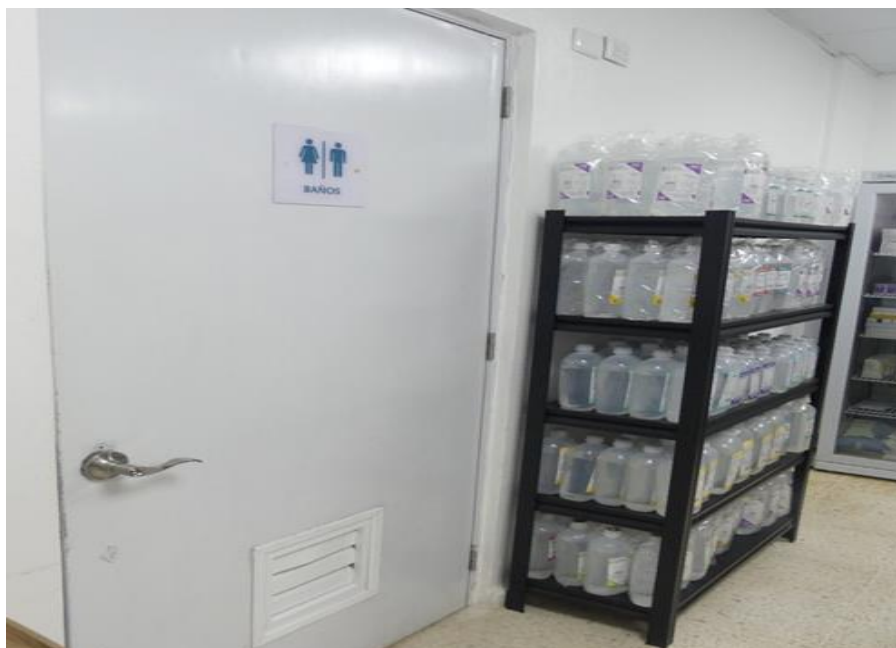
(Ilustración 16) Baño de la farmacia