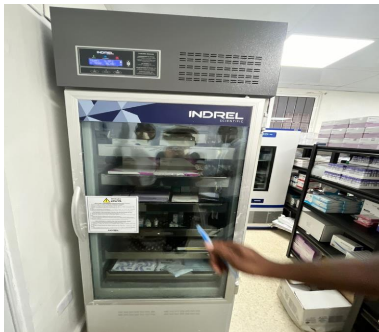
(Ilustración 8) Refrigerador de medicamentos