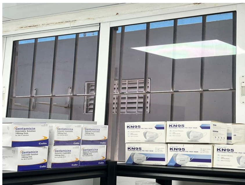
(Ilustración 13) Tintado en ventana