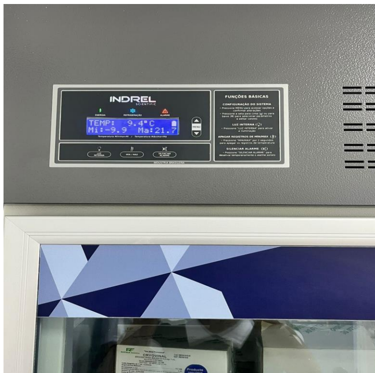
(Ilustración 7) Temperatura adecuada