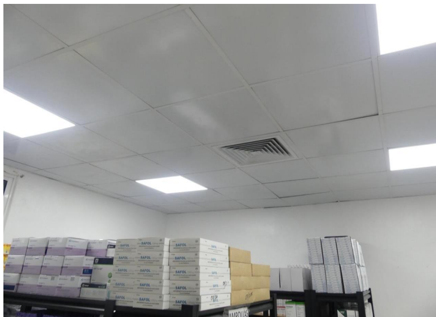
(Ilustración 14) Iluminación