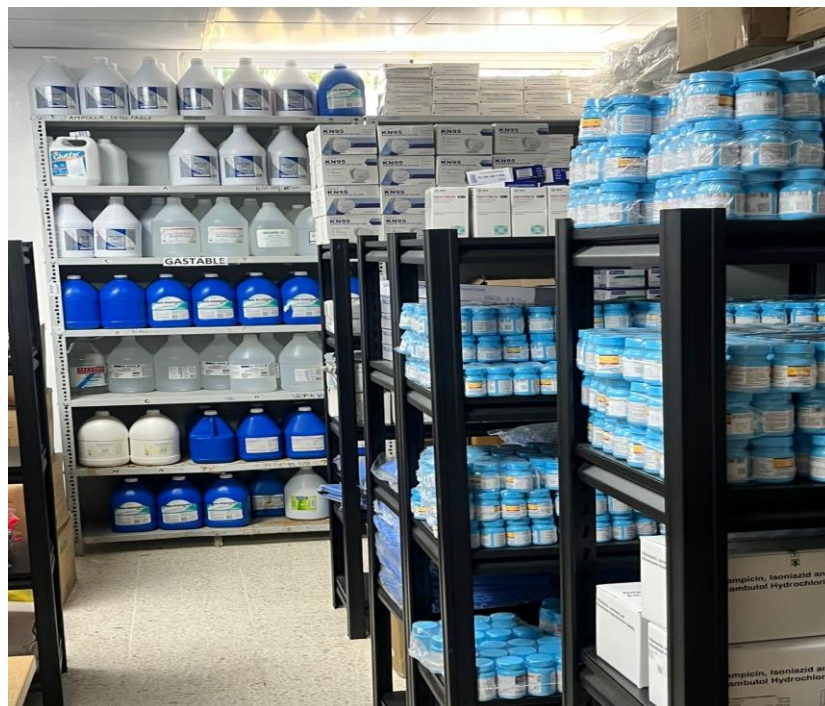
(Ilustración 4) Medicamentos de programa