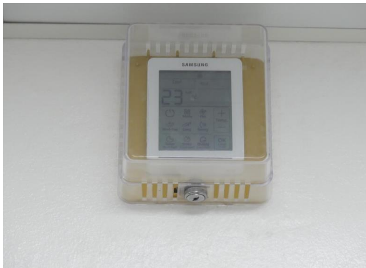
(Ilustración 5) Control de temperatura o registro