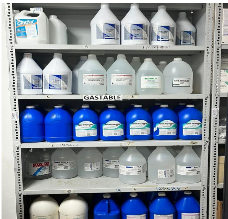
(Ilustración 6) Almacén Central, material gastable