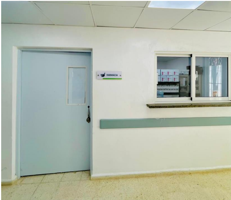
(Ilustración 1) Entrada de la farmacia central.