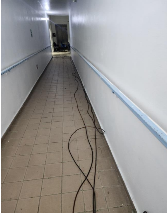
Cable viejo retirado