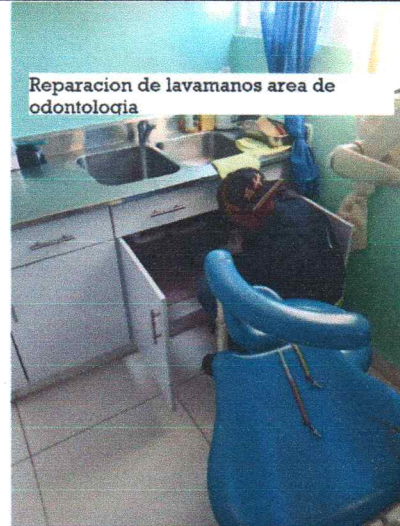
Reparacion de lavamanos area de odontologia