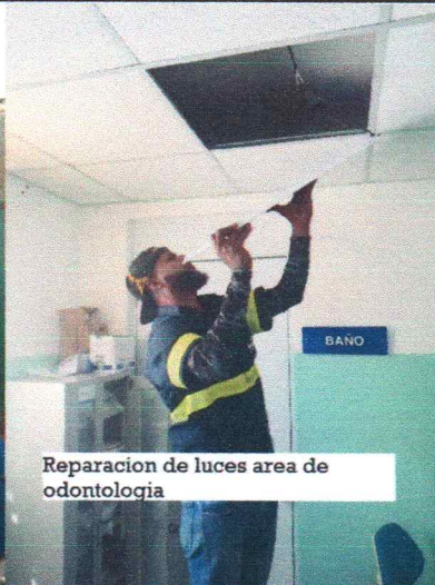
Reparacion de luces area de odontologia