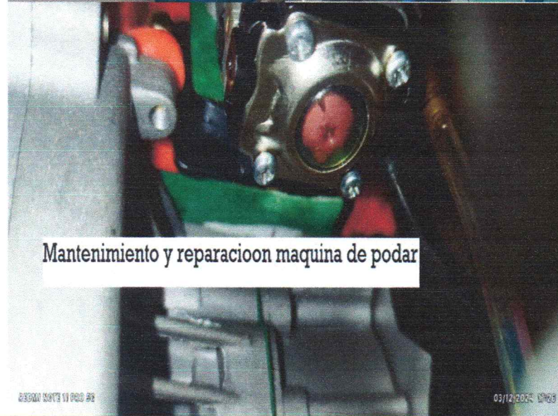
Mantenimiento y reparacion maquina de podar