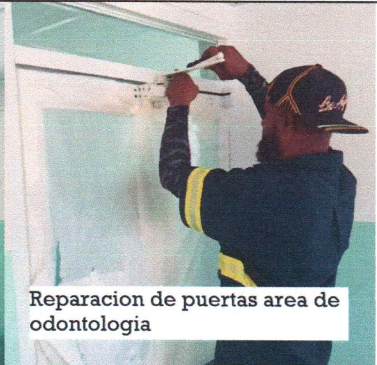
Reparacion de puertas area de odontologia