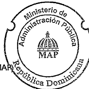
Eic. Sigmund Freund Mena Ministro del Ministerio de Administración Pública (MAP)