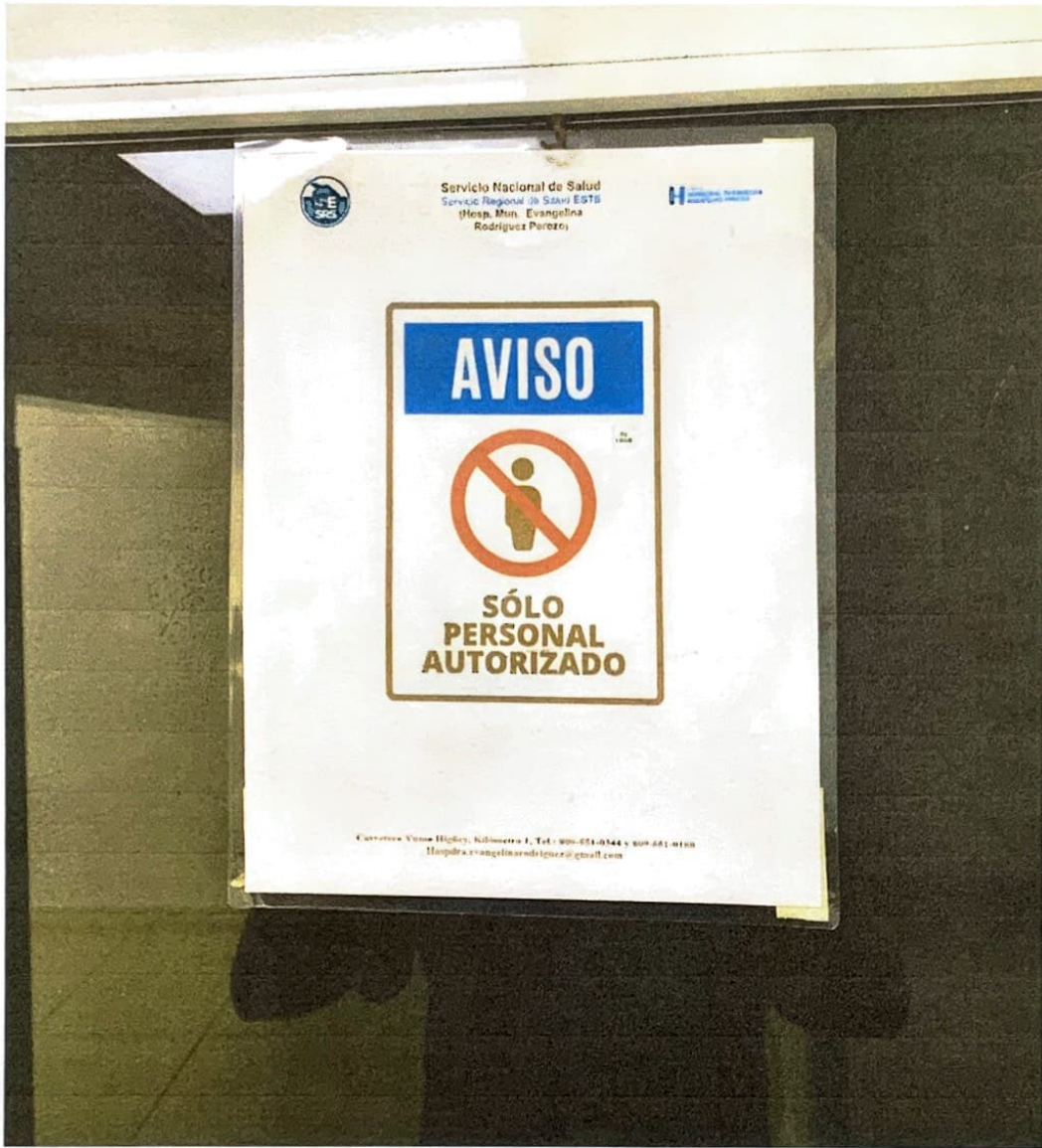
Ilustración 8 Señalística de Solo Personal Autorizado