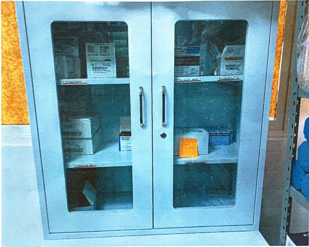
Ilustración 3 Vitrina de Medicamentos De Uso Controlado