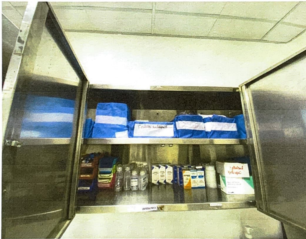
Ilustración 7 Stock de Emergencia