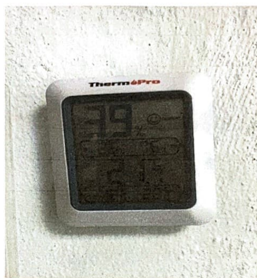
Ilustración 1 Termostatos de la Farmacia y Almacén de Farmacia