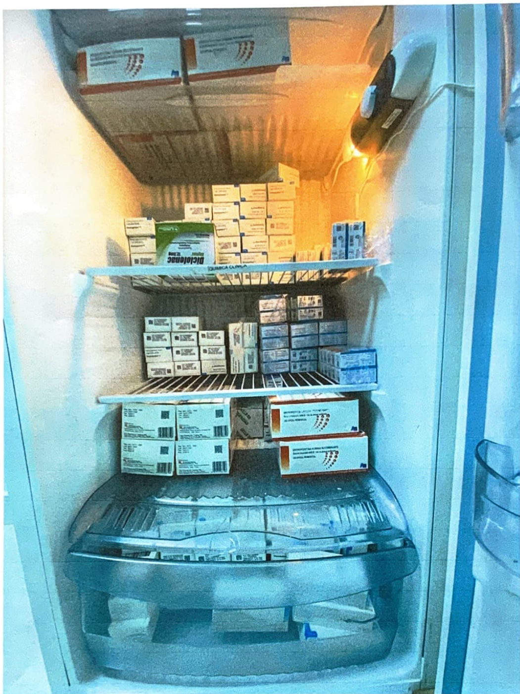
Ilustración 6 Refrigerador en Farmacia Central