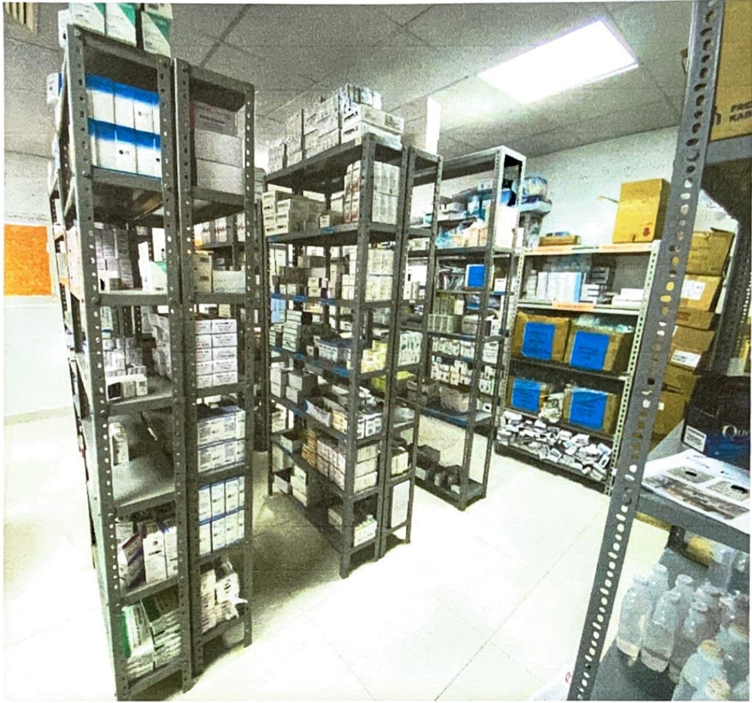
Ilustración 4 Farmacia Central: Diseño de almacenamiento en forma paralela Para un mejor desplazamiento del personal y de los productos.