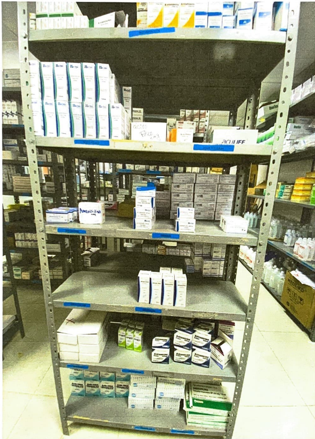
Ilustración 5 Almacenamiento de medicamento e insumo Totalmente identificado en Farmacia central