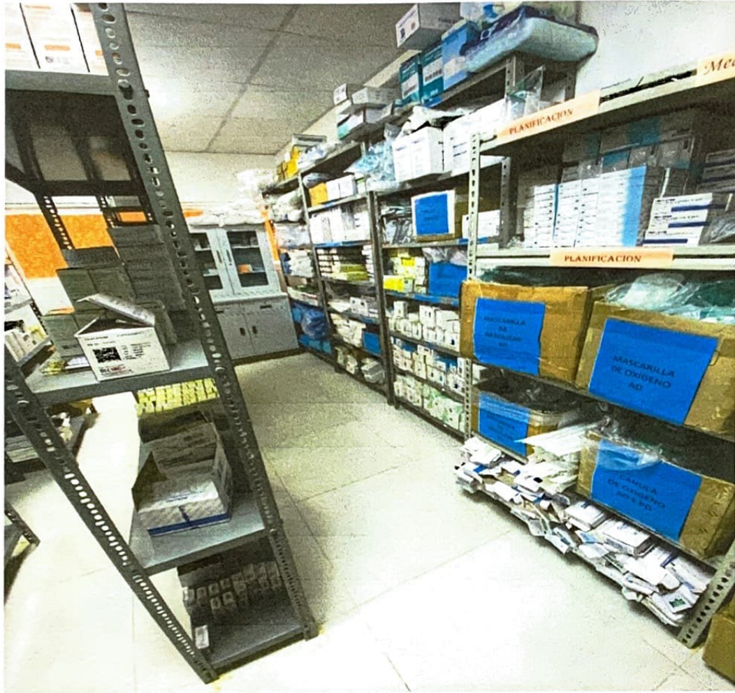
Ilustración 2 Productos en Almacén De medicamentos e Insumos