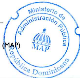
Lic. Sigmund Freund Mena Ministro del Ministerio de Administración Pública (MAP)