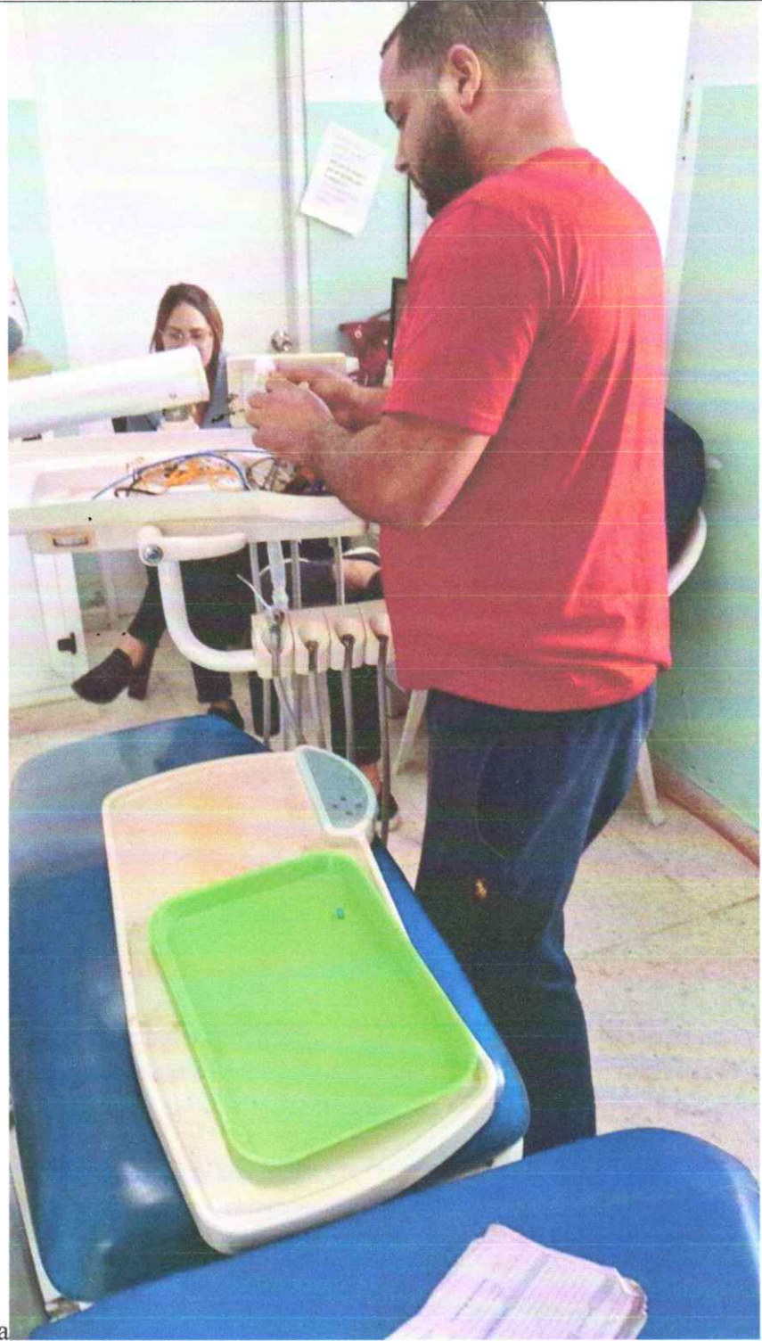
Reparación Equipo de Odontología